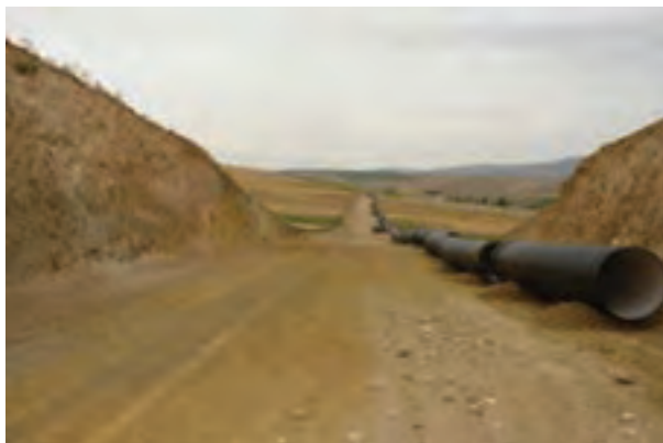
شکل ۱۳-۶- اجرای پروژه انتقال آب از سد شیرین دره به شهر بجنورد