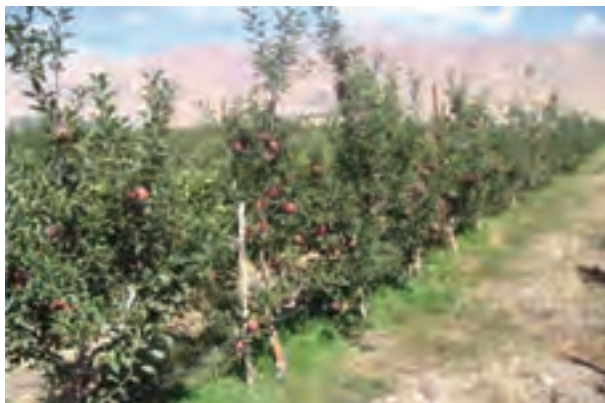
شکل ۱۴-۶- آبیاری قطره ای در باغات سیب پایه مالینگ