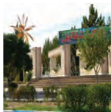
شکل ۱-۶- برخی از دستاوردهای انقلاب شکوهمند اسلامی در استان

انقلاب اسلامی در سال ۱۳۵۷ به پیروزی رسید. این انقلاب علاوه بر یک رویداد سیاسی - مذهبی، تحولی عظیم در تمام عرصه‌های اقتصادی، اجتماعی، فرهنگی، صنعتی، عمرانی و ... به وجود آورد.