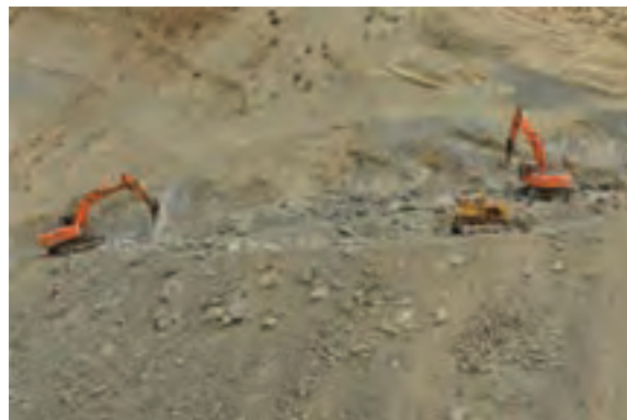
شکل ۱۰-۶- تشکیلات سخت مانعی در توسعه راه‌های استان

* به نظر شما علاوه بر موارد نام برده شده، چه مشکلات دیگری بر سر راه توسعه استان وجود دارد؟