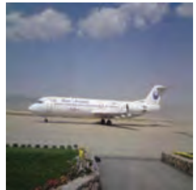
شکل ۹-۶ بخشی از توانمندی‌های استان مبنایی برای چشم انداز آینده

سی و سه سال از پیروزی انقلاب شکوهمند اسلامی می‌گذرد و درخت انقلاب امروز به حدی بزرگ و تنومند شده که شاخ و برگ آن بر تمامی گستره ایران اسلامی سایه افکنده است. پیشتر گفته شد که، بسیاری از شاخص‌های اقتصادی، اجتماعی و فرهنگی استان در سال‌های پس از انقلاب رشد چشمگیری داشته است. با توجه به دستاوردهای انقلاب شکوهمند اسلامی و با در نظر گرفتن استعدادهای خدادادی، موقعیت خاص، توان‌های محیطی، نیروی انسانی ماهر و متخصص، خراسان شمالی می‌تواند در آینده در بسیاری از زمینه‌ها رشد و شکوفایی پیدا کند. این اتفاق نمی‌افتد مگر اینکه مسئولان استان به این توانمندی‌ها توجه کنند و در راه توسعه و پیشرفت استان گام‌های اساسی را بردارند. با تمام این نقاط قوت و فرصت‌ها در مسیر توسعه استان ضعف‌ها و تهدیدهایی وجود دارد که در اینجا به برخی از آنها اشاره می‌شود: