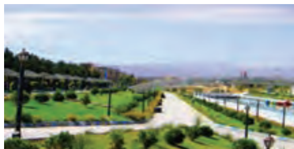
شکل ۵-۶- نمایی از پروژه‌های مهم عمران شهری در استان بعد از پیروزی انقلاب اسلامی