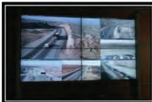
شکل ۶-۷- بخشی از فعالیت‌های انجام گرفته پس از انقلاب اسلامی در بخش راه و ترابری استان