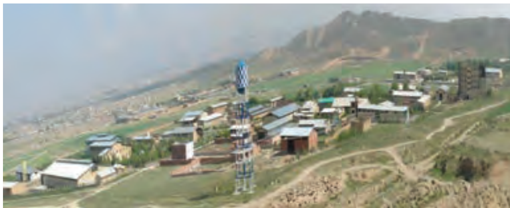
شکل ۲-۶- چشم اندازی از یک شهرک صنعتی در استان

شهرک‌ها و نواحی صنعتی ۱ استان: بعد از پیروزی شکوهمند انقلاب اسلامی، در جهت ایجاد مراکز و مهیا کردن فضایی برای رشته‌ها و حرفه‌های مختلف صنعتی، در اقدامی هماهنگ با سایر استان‌ها، در استان خراسان شمالی نیز ایجاد شهرک‌ها و نواحی صنعتی از سوی مسئولان تصویب شد و مکان‌هایی برای آنها اختصاص یافت که بسیاری از آنها به بهره‌برداری رسیده و در تعدادی از شهرستان‌ها در حال تأسیس‌اند. این اقدام از یک سو موجب جذب سرمایه‌های بخش خصوصی در مسیرهای تولیدی متناسب با نیازهای جامعه شده و از سوی دیگر زمینه اشتغال به کار جوانان را فراهم کرده است.