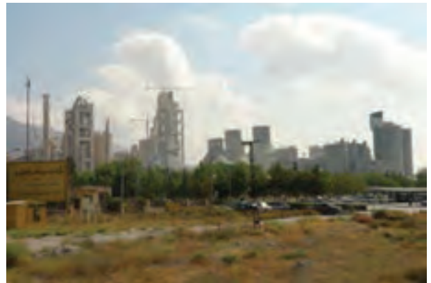
شکل ۱۵-۶- صنعت سیمان صنعتی قابل گسترش در استان