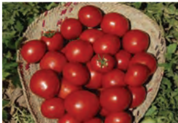
شکل ۱۲-۶- محصولات آبی که زمینه ساز توسعه صنایع تبدیلی در استان اند

ب) اهداف راهبردهای توسعه در بخش منابع آب