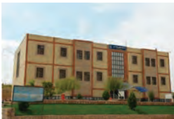
شکل ۶-۸- نمایی از پروژه‌های آموزشی استان بعد از پیروزی انقلاب اسلامی