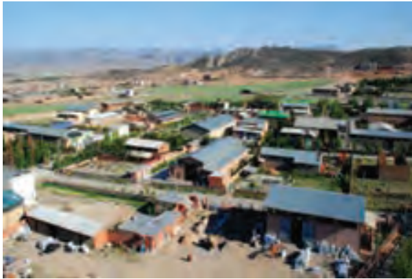
شکل ۱۶-۶- شهرک صنعتی و بستر سازی برای ایجاد اشتغال