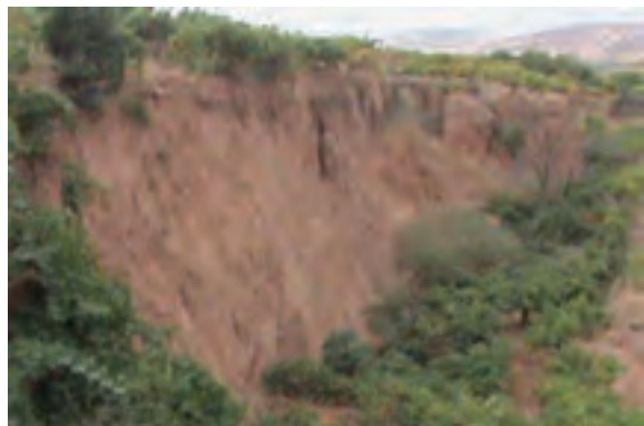
شکل ۱۱-۶- زمین لغزش در باغات روستای نرگسلو در بجنورد