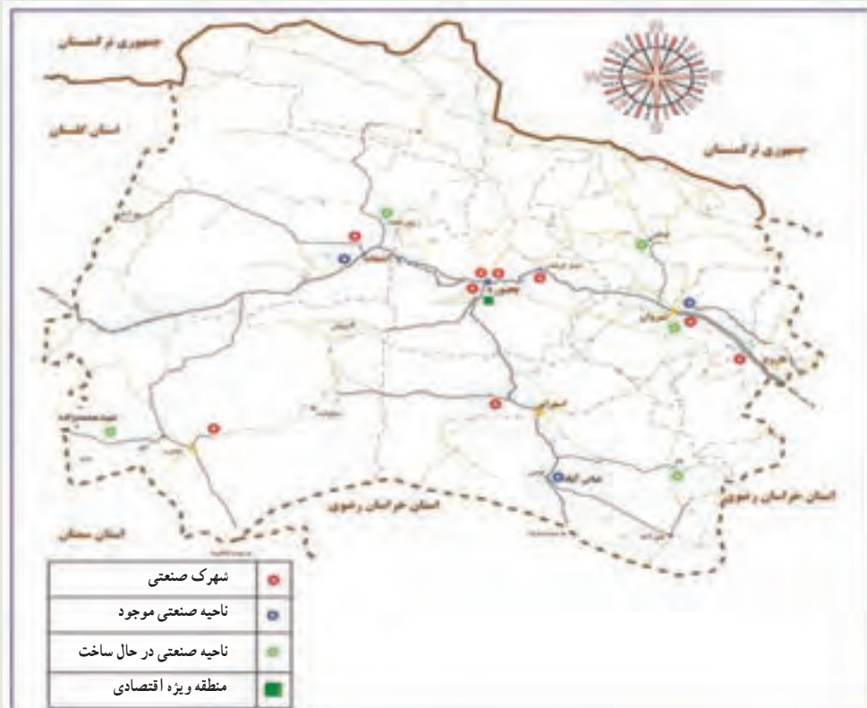
شکل ۳-۶- نقشه موقعیت مکانی شهرک‌ها و نواحی صنعتی استان