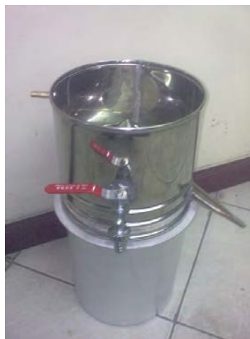
شکل ۴-۱۱ مراحل پاستوریزاسیون

در این مرحله کنترل دما و زمان فرایند پاستوریزاسیون دارای اهمیت است.