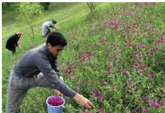
شکل ۴-۴- برداشت و انتقال گیاهان دارویی