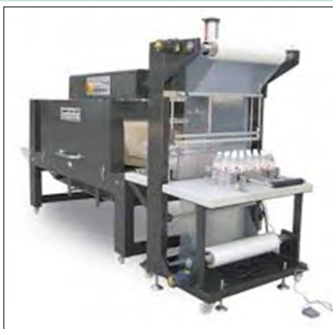
شکل ۴-۱۳- دستگاه پرکن عرقیات