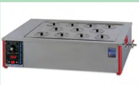
شکل ۴-۱۲- بن ماری