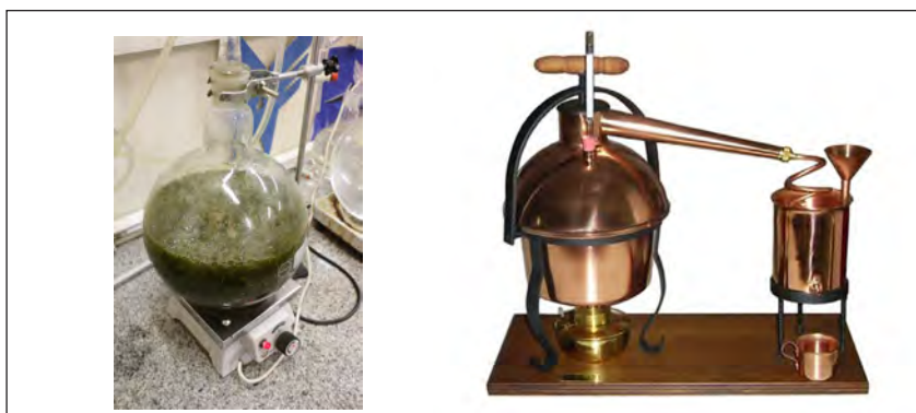
شکل ۴-۷- دستگاه تقطیر