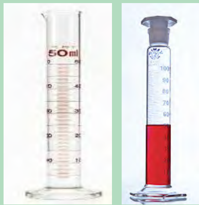
شکل ۴-۱۹- استوانه مدرج