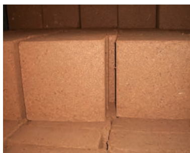
شکل کوکوپیت (قالب فشرده)

نحوه استفاده از کوکوپیت: هر قالب کوکوپیت را در ظرفی محتوی ۱۰-۸ لیتر آب (جهت غنی تر نمودن کوکوپیت می‌توان همراه آب مواد غذایی نیز اضافه نمود.) قرار داده و پس از جدا شدن الیاف از هم به صورت خالص یا به همراه پرلیت مورد استفاده قرار می‌گیرد. حجم حاصل از باز شدن الیاف هر قالب تا ۶۰-۵۰ لیتر خواهد شد.