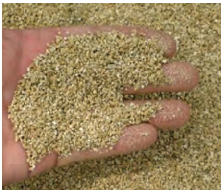
مصرف عمده ورمی کولیت در کشاورزی

ورمی کولیت انبساط یافته در اندازه‌های ۲-۴، ۰-۸ و ۲-۴ میلی‌متر تولید می‌شود. ورمی کولیت در همه اندازه‌ها سبک و دارای وزن مخصوص ظاهری ۱/۰۷-۰/۰۷ گرم بر سانتی‌متر مکعب به ترتیب برای ذرات درشت و ریز می‌باشد.