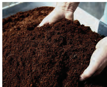
شکل کوکوپیت پس از باز شدن قالب فشرده

در ایران کوکوپیت به صورت قالب‌های چند لیتری فروخته می‌شود. وقتی قالبی ۳-۴ لیتری را خریداری می‌کنید بسیار کوچک به نظر می‌رسد اما وقتی این قالب را در ظرف آبی قرار دهید از حالت فشرده خارج شده و به حدود ۳۰-۴۰ لیتر کوکوپیت خیس تبدیل می‌شود. در واقع هر ۱ کیلوگرم از این قالب می‌تواند تبدیل به ۱۵ لیتر کوکوپیت شود. کوکوپیت در واقع خاک نیست و یک نوع کمپوست یا همان کود آلی محسوب می‌شود که برای استفاده در گلدان و خاک باغچه یا کاشت‌های هیدروپونیک بسیار مناسب است.