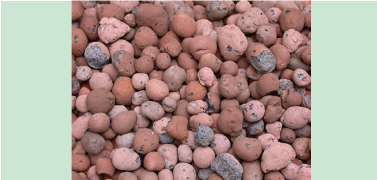
پوکه صنعتی مناسب برای کف گلدان

برای ایجاد زهکشی مناسب در کف گلدان به جای استفاده از سنگ‌های درشت و سنگین از پوکه‌های سبک معدنی استفاده می‌کنند که باعث می‌شود آب گلدان به خوبی خارج شود.