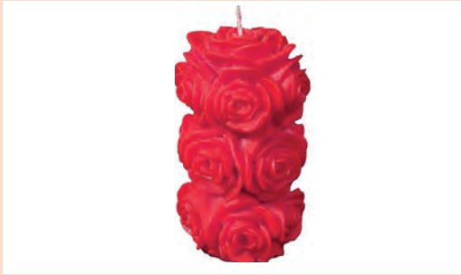
نمونه مدل آماده در بازار

ساخت قالب‌های گچی با استفاده از مدل‌های مومی آماده و موم‌زدایی قالب: پیشنهاد می‌شود پیش از آنکه تولید مدل‌های مومی به هنرجویان آموزش داده شود از مدل‌های مومی طرح‌دار موجود در بازار همانند انواع شمع که به شکل‌های گل و عروسک هستند استفاده کنید.