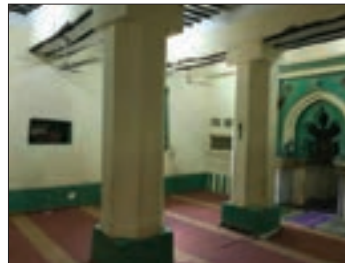
■ قدیمی‌ترین مسجد شرق آفریقا در شهر زنگبار کشور تانزانیا قرار دارد. این مسجد را ایرانیان در قرن ششم هجری ساخته‌اند.