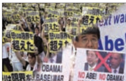
■ تظاهرات ضد امریکایی در ژاپن