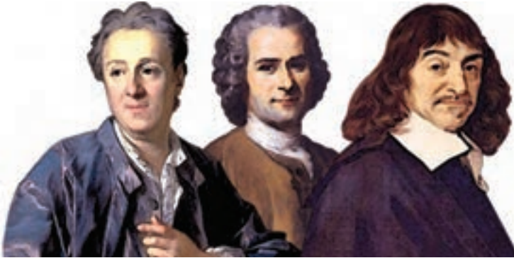
■ دکارت، روسو، دیدرو

قبلاً با معنای عام و خاص روشنگری آشنا شده و آموخته‌اید که روشنگری در معنای خاص نوعی معرفت‌شناسی است که با سکولاریسم و اومانیسم همراه می‌شود. این منظومه، فلسفهٔ روشنگری را می‌سازد. فلسفهٔ روشنگری چگونه در تاریخ فرهنگ غرب گسترش پیدا کرد؟ فیلسوفان روشنگری چه نقشی در شکل‌گیری فرهنگ جدید غرب ایفا کرده‌اند؟