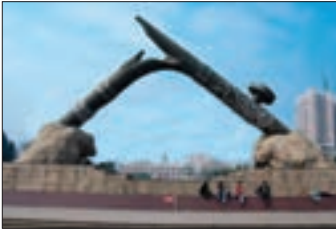
■ بنای یادبود جنگ تریاک در چین

چین که بزرگ‌ترین کشور شرق آسیا بود، در قرن نوزدهم از طریق تهدید نظامی، نفوذ گروه‌های مبلغ مسیحی و روابط اقتصادی به صورت کشوری ضعیف درآمد که هر بخش آن تحت تسلط یکی از کشورهای اروپایی بود.