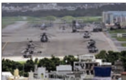
■ پایگاه نظامی آمریکا در ژاپن

جوامع استعمارزده به رغم مقاومت‌هایی که طی قرن بیستم انجام دادند، با استعمار نو و فرانو مواجه شدند.