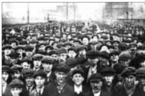
■ انبوه کارگران در دوران انقلاب صنعتی انگلستان

● اقتصاد: اقتصاد قرون وسطی بر مبنای کشاورزی و روابط اجتماعی ارباب - رعیتی بود. نظام ارباب - رعیتی در غرب که از آن با عنوان فئودالیسم یاد می‌شود، نوعی برده‌داری بود؛ زیرا کشاورزان، وابسته به زمین‌های اربابان خود بودند و امکان جابه‌جایی نداشتند. گسترش تجارت و به دنبال آن رشد صنعت، قشر جدید سرمایه‌داران را به وجود آورد؛ بدین ترتیب، اقتصاد کشاورزی فئودالی به اقتصاد صنعتی سرمایه‌داری متحول شد و روابط ارباب - رعیتی به روابط کارگران - سرمایه‌داران تغییر یافت.