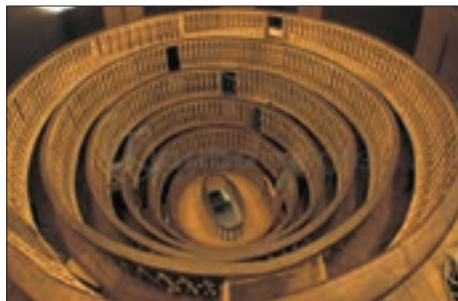
■ کلاس تشریح، دانشگاه پادوا ایتالیا

در رویکرد جدید، علوم تجربی در بین علوم مختلف بیشترین اهمیت را پیدا کرد. فناوری و صنعت، رهاورد این بخش از علوم بود. در قرن هجدهم، انقلاب صنعتی از انگلستان آغاز شد و به تدریج در دیگر کشورهای اروپایی گسترش یافت.