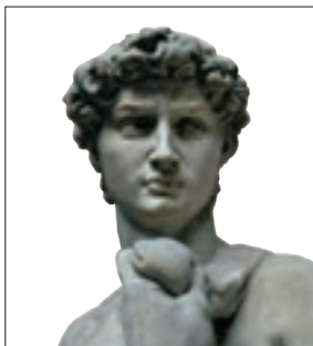
■ مجسمه داوود اثر میکل آنژ؛ بازگشت به هنر یونان باستان