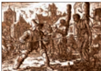
■ شکنجه و قتل آناپاپتیست‌ها

آناپاپتیست‌ها گروهی از پروتستان‌ها بودند که با جریان‌های دنیاگرایانه‌ای که از دوران رنسانس پدید آمده بود به مخالفت برخاستند. این گروه با تحولات اجتماعی بعدی جهان غرب همراهی نکردند. آمیث‌ها گروهی از پروتستان‌ها هستند که از قرن شانزدهم تا امروز، شیوه زندگی خود را تغییر نداده‌اند.