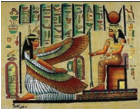
■ تصویر فرعون، نقاشی‌های دیواری مصر باستان

او ناگزیر بود خود را در زمره خدایان معرفی کند تا بتواند موقعیت و رفتار ظالمانه خود را توجیه نماید و می‌گفت: «أنا رَبُّكُمْ الْأَعْلَى؛ من پروردگار برتر شما هستم.» ولی انسان مدرن خواسته‌های دنیوی و این جهانی خود را بدون آنکه نیازی به توجیه الهی و آسمانی داشته باشد به رسمیت می‌شناسد.