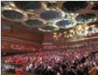
■ مسابقات بین‌المللی قرآن در مالزی

جامعه جهانی قبل از ظهور غرب جدید به صورت امروز نبوده است؛ فرهنگ‌ها و تمدن‌های مختلف، هر یک در بخشی از جهان، حاکمیت سیاسی مربوط به خود را به وجود آورده بودند. روابط اقتصادی، سیاسی، نظامی و فرهنگی بین کشورهای مختلف با حاکمیت‌های متفاوت برقرار بود و جامعه جهانی که از طریق این روابط شکل می‌گرفت به گونه‌ای نبود که سرنوشت تعاملات فرهنگی را تابع روابط سیاسی، نظامی یا اقتصادی قرار دهد. به همین دلیل اگر برخی کشورها مورد هجوم نظامی قرار می‌گرفتند، در صورتی که از ظرفیت فرهنگی برتری برخوردار بودند، گروه مهاجم را درون خود هضم و جذب می‌کردند. فرهنگ‌های مختلف نیز می‌توانستند از مرزهای جغرافیایی خود از طریق روابط تجاری یا گفت و گوهای مستقیم علمی و معرفتی، عبور کنند. برای نمونه فرهنگ ایرانی در دوره حاکمیت سلوکیان، هویت خود را حفظ کرد. چین با آنکه از مغولان شکست خورده بود، فرهنگ خود را بر آنان تحمیل کرد. نشر و گسترش اسلام نیز متکی بر قدرت سیاسی و نظامی آن نبود بلکه مرهون قوت و قدرت فرهنگی آن بود. ایرانیان، به تدریج اسلام را پذیرفتند. مسلمانان آسیای جنوب شرقی از طریق تجارت با فرهنگ اسلامی آشنا شدند و به آن روی آوردند.