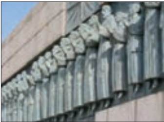
■ یادمان ۲۶ مبلغ کاتولیک رومی در ژاپن

عراق، سوریه، فلسطین، مصر، ترکیه کنونی تا بلغارستان و بالکان گسترده بود و مرزهای جوامع اروپایی را تهدید می‌کرد. امپراتوری عثمانی نیز در اثر نفوذ گروه‌های مبلغ مسیحی و فراماسونری، تهدید نظامی و روابط اقتصادی از هم پاشید؛ بخش‌های عمده‌ای از آن جدا شدند و ده‌ها کشور از جمله مصر، سوریه، لبنان، اردن، عربستان، عمان، یمن، عراق و کویت از درون آن سربرآوردند و هر کدام تحت سلطه یکی از کشورهای اروپایی قرار گرفتند. ژاپن که از قرن هفدهم و بعد از نفوذ مسیحیت، دروازه‌های خود را به روی کشورهای غربی بسته بود، با تهدید کشورهای اروپایی مجبور به برقراری روابط تجاری تحت شرایط مورد نظر این کشورها شد.