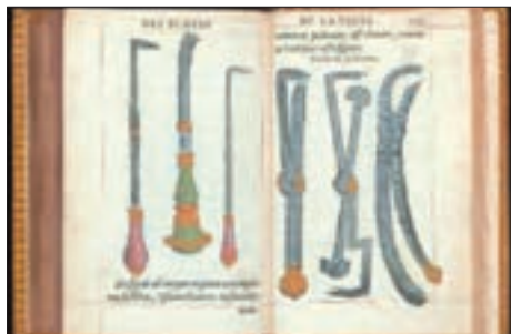
■ ابزارهای جراحی معرفی شده در کتاب «شیوه‌های درمان زخم‌ها و شکستگی‌های بدن انسان»

● علم و فناوری و صنعت: علم جدید با رویکرد دنیوی خود، دیگر وظیفه شناخت حقیقت عالم و مسئولیت عبور انسان را از ملک به ملکوت برعهده نداشت بلکه به تدریج به ابزار تسلط انسان بر طبیعت تبدیل شد و از این جهت به دستاوردهای شگرفی نائل آمد.