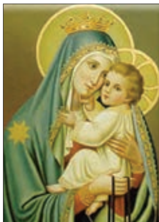
■ هنر قرون وسطی بر بعد معنوی وجود انسان تأکید داشت اما هنر مدرن به بعد جسمانی وجود انسان توجه دارد.