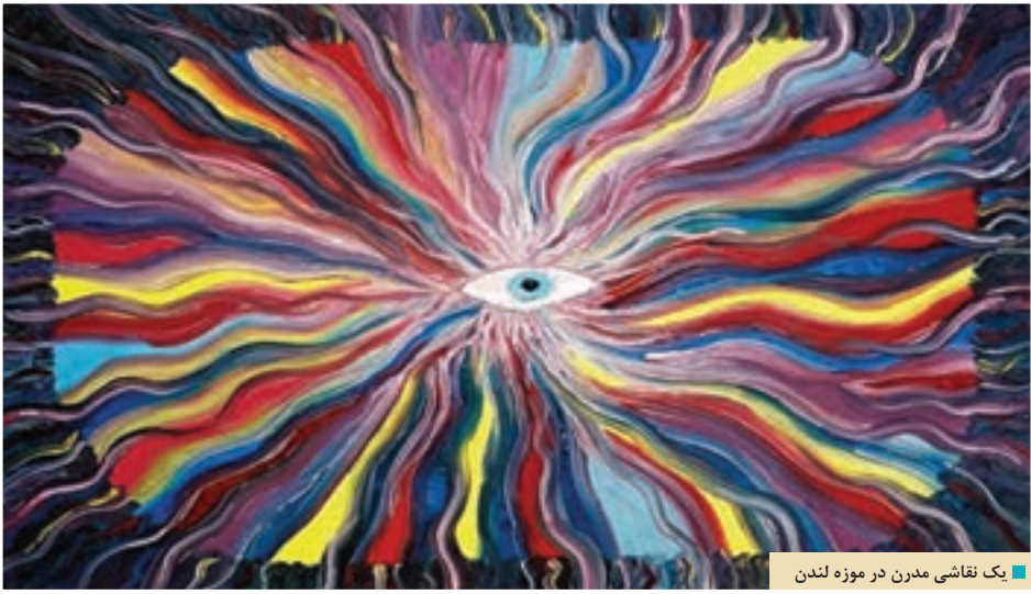
یک نقاشی مدرن در موزه لندن