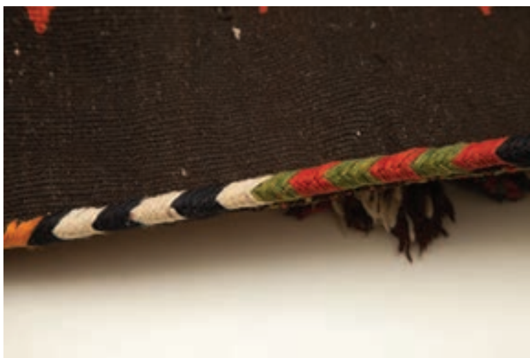
نمونه شیرازه جناقی یک‌رنگ و دورنگ در کنار یکدیگر

به نظر شما شیرازه جناقی بیشتر در چه فرش‌هایی و در چه مناطقی استفاده می‌شود؟ این نوع شیرازه‌ها (مخصوصاً شیرازه جناقی دو رنگ) بیشتر در فرش‌های عشایری روستایی مناطق فارس دیده می‌شود و شیرازه جناقی ساده در فرش‌های عشایر شاهسون، افشار، رخی عشایر کرد، ترکمن و ... متداول است.