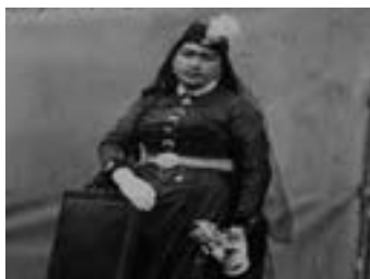
انیس الدوله همسر ناصرالدین شاه