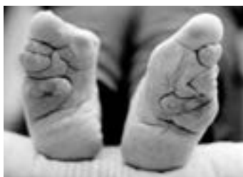
پاهای زنان چینی در گذشته

زنان در مقابله با این فشار برای لاغر شدن از طریق رژیم گرفتن، واکنش نشان می‌دهند. بیشتر این رژیم‌ها برای حفظ ظاهر است تا سلامتی. درصد بالایی از افراد شکل بدن خود را دوست ندارند و رژیم گرفتن برای همهٔ سنین از نه سالگی تا کهنسالی به یک دغدغه تبدیل شده است. شگفت‌انگیز نیست که به این افراد مشاوره داده می‌شود که برای غذا خوردن احساس گناه کنند. پژوهشی نشان می‌دهد که در طول یک دهه تعداد مقالات در مورد رژیم گرفتن نسبت به دهه قبل دو برابر شده است و این نکته مهم است که رژیم گرفتن و ورزش نه با هدف سلامتی که با هدف زیبایی انجام می‌شود و سلامتی فقط به آن مشروعیت می‌دهد.