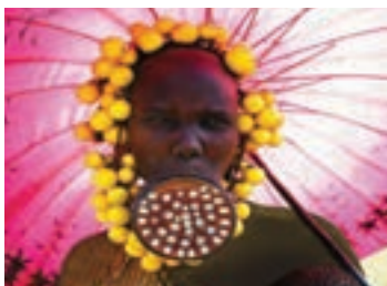
زنی از قبیله مرسی در اتیوپی

امروزه ما در دوره‌ای زندگی می‌کنیم که لاغر بودن به مهم‌ترین ویژگی پسند افراد تبدیل شده است و اکثر ما می‌خواهیم لاغر باشیم. در واقع تا قبل از سن شش سالگی کودکان از طریق پیام‌های تصویری یاد می‌گیرند که افراد چاق را به عنوان افراد زشت، تنبل، ناسالم، و... بشناسند. از تصاویر موجود می‌توان به معیارهای زیبایی در فرهنگ‌ها و دوره‌های تاریخی پیشین پی برد. این تصاویر نشان می‌دهند که زیبایی در آن فرهنگ و دوره چگونه بوده است. آرمان‌ها دربارهٔ زیبایی بر اساس توافقات اجتماعی ساخته می‌شود. به عنوان مثال، تصویر زنان زمان قاجار و تصاویر بستن پاهای دختران چینی با قالب چوبی در کودکی (برای کوچک ماندن پا و قدم کوتاه برداشتن)، نشان می‌دهد که چطور در قرون گذشته و در فرهنگ‌های مختلف معیارهای زیبایی متفاوت بوده است.