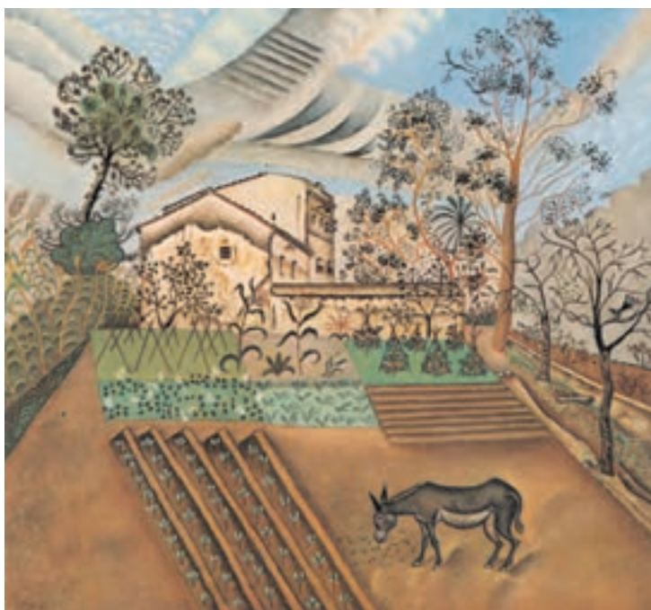
تصویر ۲-۲ اثر خوان میرو ۲ ، رنگ روغن روی بوم، (۶۰×۷۰ سانتی‌متر)