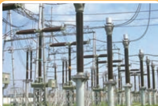
پست تقویت ولتاژ جریان برق

همان‌طور که در شکل (۵-۲) نشان داده شده است جریان الکتریسیته با ولتاژ بسیار بالا به طور معمول در حد چند ده هزار ولت می‌رسد. توسط دکل‌های بزرگ انتقال برق به طرف شهرها و یا واحدهای صنعتی منتقل می‌شود، تا اینکه در مجاورت شهرها وارد ایستگاه‌های تقلیل ولتاژ می‌شود و ولتاژ آن کاهش می‌یابد. سپس جریان الکتریکی به صورت تک فاز یا سه فاز (۲۲۰ یا ۳۸۰ ولت) توسط شبکه توزیع به واحدهای مصرف کننده منتقل می‌شود.