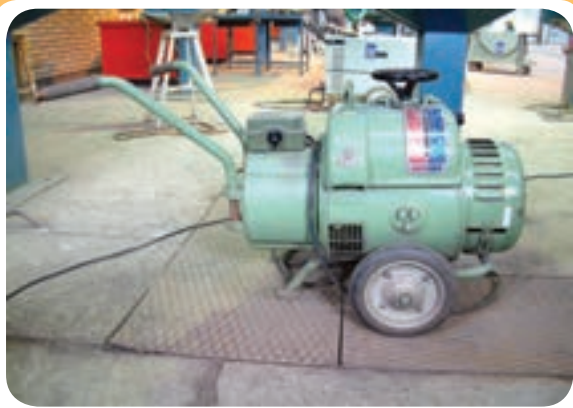
دینام جوش کارگاهی

دینام جوشکاری یک مولد جریان مستقیم است و از یک موتور که ژنراتور مولد جریان مستقیم را به گردش در می‌آورد، تشکیل شده است. اگر موتور محرکه دینام از نوع الکتریکی باشد دینام جوش کارگاهی نامیده می‌شود (۵-۱۸) و اگر بنزینی یا گازویلی باشد، موتور جوش نامیده می‌شود.