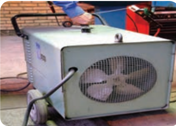
ترانسفورماتوری که شدت جریان خروجی با جابجایی هسته صورت می‌گیرد.

تغییر آمپر در بعضی از دستگاه‌هایی ترانسفورماتور ممکن است با جابه جا کردن هسته فرعی درون هسته اصلی مطابق آنچه که در شکل (۹-۵) مشاهده می‌شود، انجام پذیرد که در این صورت با گردش دسته، تغییر آمپر انجام می‌گیرد و نشانه مخصوص در مقابل اعداد، میزان آمپر خروجی دستگاه را نشان می‌دهد.