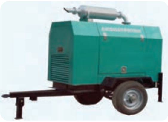
موتور جوش‌های احتراقی که در محل‌های نصب سازه‌های فلزی مورد استفاده قرار می‌گیرند.

موتور جوش‌هایی که در سایت‌ها محل‌های نصب سازه‌های فلزی و یا در راه‌سازی و پل‌سازی مورد استفاده واقع می‌شوند به طور معمول دارای یک موتور احتراق (بنزینی یا گازویلی) هستند که با استارت راه‌اندازه می‌شوند (شکل ۵-۲۲). راه‌اندازی، موتور احتراقی و کنترل روغن، سوخت و غیره بر اساس دفترچه راهنما دستگاه باید صورت گیرد و استفاده از مولد جریان جوشکاری، کابل‌های اتصال و انبر نیز مشابه دینام جوش کارگاهی است.