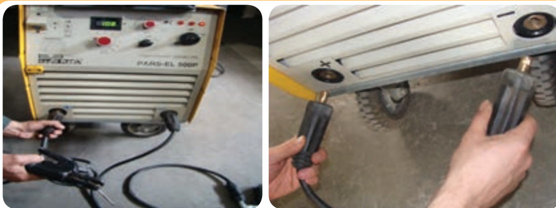
ترمینال‌های خروجی شدت جریان جهت اتصال کابل جوشکاری