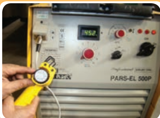
تنظیم آمپر از کنار دست جوشکار توسط سیستم کنترل از راه دور