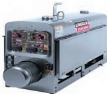
دو مدل از مولدهای جریان جوشکاری که با سوخت مایع کار می‌کنند.

مولدهای جوش سیار در سایت‌ها و مکان‌های دور از شبکه برق صنعتی مثل: سکوهای شناور در دریا و اقیانوس‌ها و مکان‌های نصب آنتن‌های مخابرات در ارتفاعات به کار گرفته می‌شود و با استفاده از موتور احتراق داخلی، حرکت دورانی جهت گردش محور دینام مولد جریان جوشکاری تأمین می‌گردد.