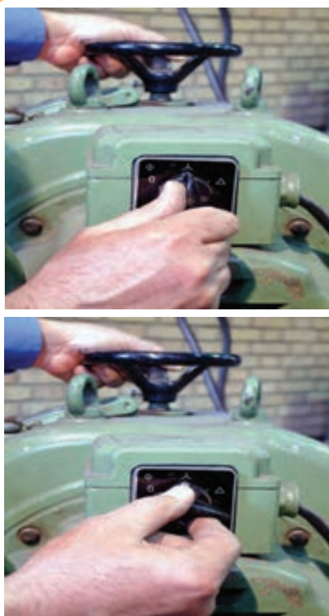
دینام جوش کارگاهی و کلیدهای مخصوص روشن و خاموش کردن دستگاه

راه‌اندازی دینام جوش کارگاهی به طور معمول از طریق کلید روشن ۱ و خاموش ۲ که روی دستگاه مطابق شکل (۲۰-۵) تعبیه شده صورت می‌گیرد. ولی در بعضی از دستگاه‌ها روشن و خاموش کردن از طریق کلید ستاره و مثلث صورت می‌گیرد. در این حالت ابتدا باید کلید را از حالت خاموش در حالت ستاره قرار دهیم و پس از چند ثانیه که موتور به دور نهایی رسید، آن را به حالت مثلث تغییر وضعیت دهیم تا دستگاه به کار خود ادامه دهد (شکل ۲۰-۵).