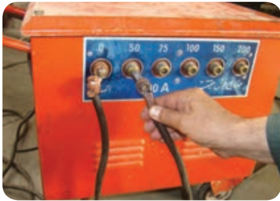
تنظیم آمپر در دستگاه ترانسفورماتور پله‌ای

امروزه بعضی از دستگاه‌های ترانسفورماتور جوشکاری دارای یک صفحه کوچک نمایش آمپر نیز هستند که موقع برقرار بودن قوس الکتریکی میزان آمپر جوشکاری را نیز نشان می‌دهد.