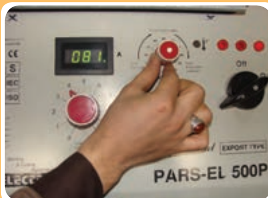
کلید انتخاب جریان مناسب بر حسب نوع الکتروود جوشکاری