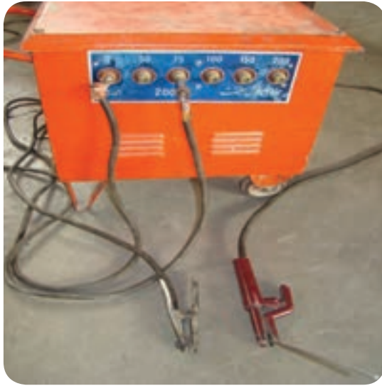
ترانسفورماتور جوشکاری جریان برق شهری را به جریان جوشکاری تبدیل می‌کند.