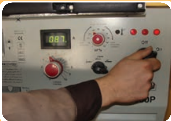
کلیدهای مختلف روی صفحه اصلی رکتی‌فایر جوشکاری

مطابق دستگاه‌های معمول جوشکاری، کلیدهای مختلف قطع و وصل و تنظیم دستگاه با سیگنال مرتبط روی صفحه اصلی رکتی‌فایر مشاهده می‌شود. (شکل ۵-۱۳).