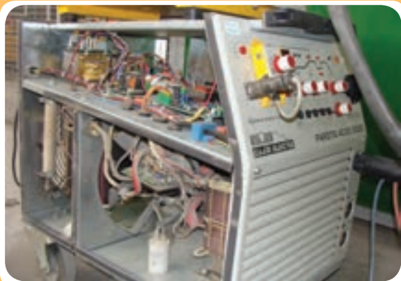
سیستم الکترونیکی تبدیل جریان متناوب بر جریان مستقیم در رکتی‌فایرهای جوشکاری

در حقیقت رکتی‌فایرهای جوشکاری همان دستگاه‌های ترانسفورماتور هستند که یک سیستم یکسو کننده‌گی جریان الکتریسته به آنها اضافه شده است و در (شکل ۵-۱۲) این تجهیزات الکترونیکی در قسمت فوقانی دستگاه نشان داده شده است.