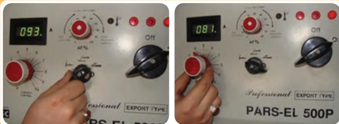
کلیدهای مختلف برای تنظیم دستگاه جوشکاری

هم‌چنین برخی از رکتی‌فایرهای جوشکاری ممکن است دارای کلید انتخاب جریان مناسب بر حسب نوع الکتروود جوشکاری باشند که باعث راحتی کار جوشکاری و پایداری قوس می‌شود (شکل ۱۵-۵). گاهی ممکن است دستگاه رکتی‌فایر جوشکاری دارای سیستم تنظیم آمپر از کنار دست جوشکار نیز باشد که این قابلیت توسط یک فیش و مادگی مطابق آنچه در (شکل ۱۶-۵) مشاهده می‌شود میسر می‌گردد.