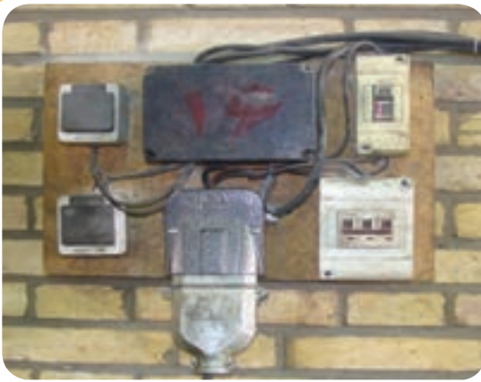
فیش مخصوص اتصال کابل دستگاه جوشکاری به تابلو برق

ترانسفورماتور جوشکاری به‌طور معمول بوسیله یک فیش صنعتی به برق شهر وصل می‌شود و به‌وسیله دو ترمینال خروجی که کابل‌های انبر و اتصال به آنها وصل می‌شود، جریان مناسب را در اختیار جوشکار قرار می‌دهند. (شکل ۵-۵)