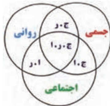
ارتباط ابعاد جسمی، روانی، اجتماعی در انسان

اغلب مردم برای تعیین سلامت افراد، به ظاهر فیزیکی آن‌ها توجه می‌کنند و اگر در ظاهر آن‌ها نشانه‌ای از درد و علائمی از بیماری جسمی مشاهده نشود او را شخصی سالم می‌دانند. براساس تعریفی که در اساس نامهٔ سازمان جهانی بهداشت ۱ آمده است، سلامت عبارت است از رفاه کامل جسمی، روانی و اجتماعی و نه فقط نبودن بیماری و معلولیت