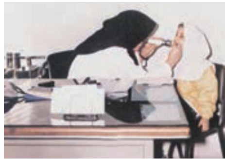
۳- سطح سوم: این سطح از پیشگیری زمانی مطرح از عینک و ... است.

بیماری یعنی تب رماتیسمی در شخص مبتلا می‌شود.