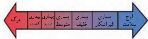
شکل طیف سلامت و بیماری

سلامت و بیماری دارای درجات مختلفی است. عده‌ای از مردم در ظاهر هیچ‌گونه ناراحتی یا علامتی از بیماری ندارند اما با انجام آزمایش و معاینه دقیق مشخص می‌شود که آن‌ها بیمارند. این‌گونه بیماری‌ها را بیماری‌های بدون علامت می‌نامند. در اغلب بیماری‌ها نشانه‌هایی هست که سبب تشخیص آن بیماری‌ها می‌شود، بیماری شدید شکل دیگر بیماری است که ممکن است به معلولیت و حتی مرگ منتهی شود. بنابراین طیف سلامت و بیماری از نقطه اوج سلامت شروع و به مرگ منتهی می‌شود.