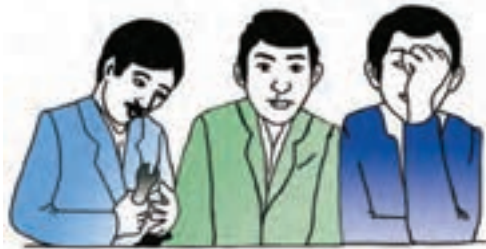
بشنو و فراموش کن ..... ببین و به خاطر بسپار ..... عمل کن و بفهم

گاهی اوقات یادگیری فقط از طریق دیدن رفتار سایرین شکل می‌گیرد.