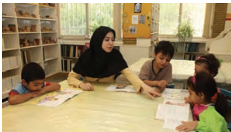
شکل ۱۱ - فضایی برای قصه‌گویی