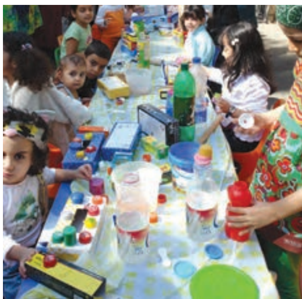
شکل ۹- کاردستی با وسایل بی‌مصرف

انگشتان، آبرنگ، مداد شمعی و غیره. ■ کاردستی: قیچی ، کاردک‌های گوناگون، قالب، وردنه و انواع خمیر (خمیربازی، گل رس، خمیر روزنامه و...) مجموعه‌ای از تکه‌های کاغذ، پارچه، کاغذ دیواری، کاموا، تور، پر، گیره کاغذ، بند کفش، خلال دندان، بشقاب‌های کاغذی، دانه حبوبات، دانه‌های تیره مغزها (فندق، گردو، بلوط)، هسته میوه‌ها و انواع چسب برای کولاژ و جمع‌آوری وسایل بی‌مصرف مانند درهای بطری، جعبه‌های مقوایی، کارتن‌های خالی، دستمال کاغذی و روزنامه‌ها که می‌توانند به‌عنوان ابزار مفید در این مرکز مورد استفاده قرار گیرند (شکل ۹). ■ به نمایش گذاشتن کار کودکان و نصب آنها بر دیوارها و یا آویختن آنها، خود نوعی آموزش است که بسیار مفید است (شکل ۱۰).