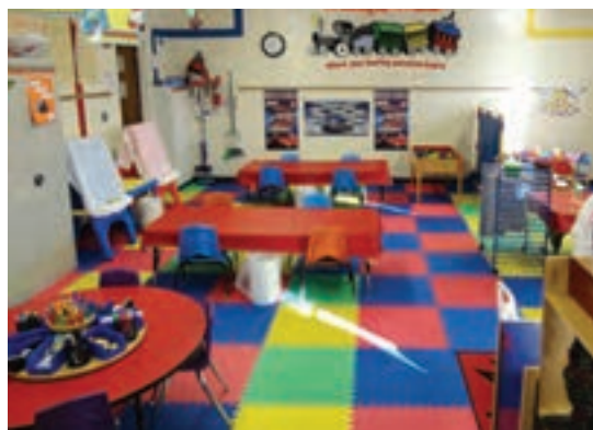
شکل ۲۴- سالن چندمنظوره

■ چیدمان: فعالیت‌ها باید به گونه‌ای باشد که یک فعالیت مانع فعالیت دیگر نشود. فعالیت‌های آرام و فعالیت‌های شلوغ و پرسروصدا به گونه‌ای قرار گیرند که کار یک گروه برای گروه دیگر مسئله‌ای ایجاد نکند. مثلاً مرکز کتابخانه کنار مرکز آجرک‌ها یا خانه عروسکی نباشد.