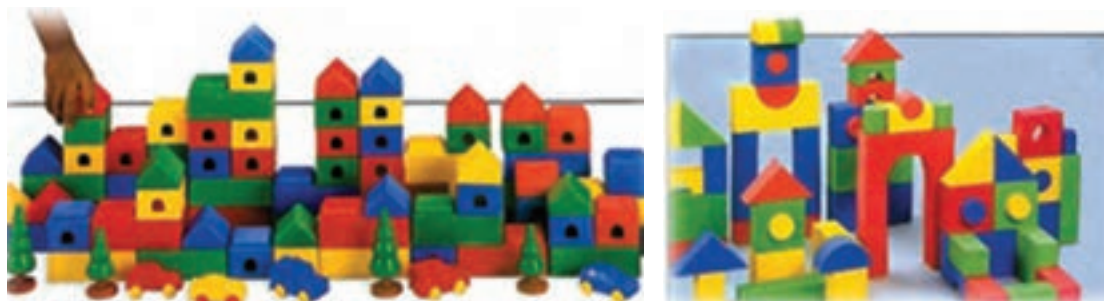
شکل ۶- شکل‌های گوناگون آجرک‌ها

و... مورد استفاده قرار می‌گیرد (شکل ۶). ■ محل استفاده از این آجرک‌ها علاوه بر تمیز بودن باید مغروش باشد و محل رفت‌وآمد نباشد. ■ مسیرهای ارتباطی مثل در و یا بین چند قفسه که برای فعالیت‌های دیگر منظور شده‌اند مانند قفسه کتاب نمی‌تواند برای این فعالیت مناسب باشد.