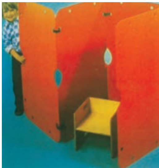
شکل ۱۴- نمونه‌ای از خانه عروسکی دست‌ساز. اندازه برای بخش نوپا ۱۲۵×۹۰cm، اندازه برای بخش کودکستانی ۱۵۰×۹۰cm