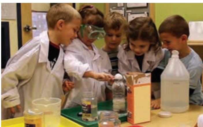
شکل ۲۰- محل انجام فعالیت‌های علوم