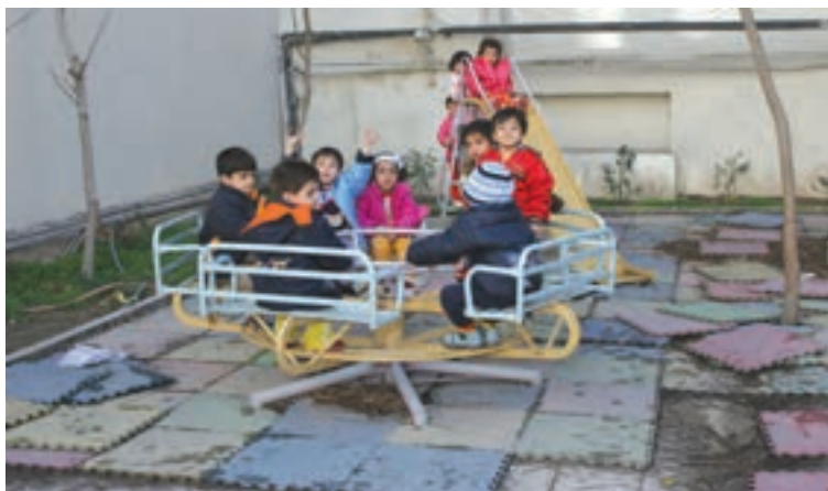
شکل ۲۳- نامناسب بودن کف پوش و محل استقرار سرسره و چرخ‌فلک

۳- چرخ‌فلک: یکی دیگر از وسایل بازی کودکان چرخ‌فلک است که به اشکال گوناگون تک‌نفره و چندنفره وجود دارد. پوشش زمین، چمن یا فوم است و باید به زمین متصل باشد. سطح گذاشتن پا باید بسته باشد تا پای بچه‌ها در آن گیر نکنند. ترکیب چرخ‌فلک، با تاب، سرسره و الاکلنگ در کنار هم و بدون رعایت فاصله خطرناک است ۱ (شکل ۲۳).