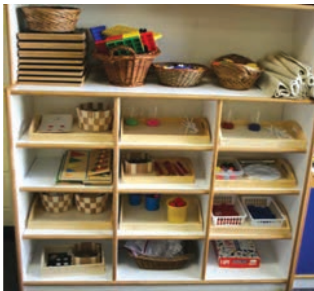
شکل ۸ - قفسه

■ نقاشی: مداد، مداد رنگی، گچ رنگی، تخته سفید ۱ یا تخته سیاه، کاغذ، قلم‌موی گرد ۲/۵ cm برای کودکان، قلم‌موی مسطح و گرد برای کودکان بزرگ‌تر، قلم‌موی بلند برای کار روی سه پایه، رنگ برای نقاشی با