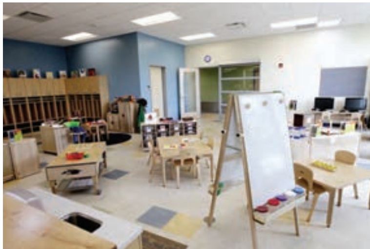
شکل ۳- ویژگی‌های مکانی (سقف، کف، دیوار ...)