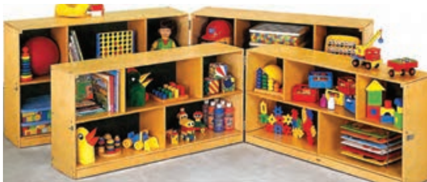
شکل ۲۵- نمونه‌هایی از قفسه‌های کوتاه مرتب

■ شروع فعالیت‌ها: فعالیت‌ها گاهی توسط مربی از قبل روی میزها مشخص می‌شوند. او با گذاشتن رنگ و کاغذ در بخش هنر یا قرار دادن چند کتاب روی میز و غیره می‌تواند کودکان را ترغیب به انجام یک فعالیت نماید. معمولاً همه کودکان به یک فعالیت نمی‌پردازند، آنها می‌توانند آزادانه فعالیتی را آغاز و پس از انجام آن، به فعالیت دیگری مشغول شوند. نکته مهم در اینجا اعتمادی است که بین مربی و کودک وجود دارد و کودک می‌داند که نوبت او هم خواهد شد. به کودکان بیاموزید که پس از هر فعالیت، باید ابزار مورد استفاده را در جای خود قرار دهند و نظم را رعایت کنند. تمیز نگاه داشتن فضا از جمله مواردی است که مدام باید گوشزد شود. یک سالن چندمنظوره با چیدمان درست و قفسه‌های مرتب، فضای دلچسبی است که کودک و مربی توانمند از آن لذت خواهند برد.