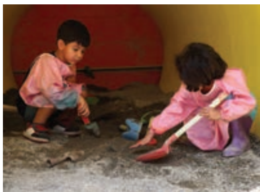
شکل ۱۳- فضای شن بازی