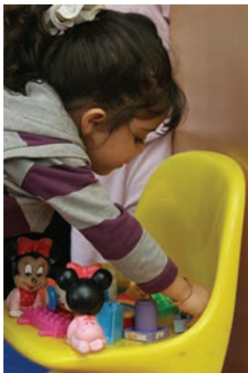
شکل ۱۹- بازی با کمبود جا

■ تنوع وسایل: چنانچه تنوع وسایل کم و فضا محدود باشد، امکان کمتری برای بیان ایده‌ها و فعالیت به وجود می‌آید و بازی محدودتر و حیطة وانمود کردن، بسته‌تر می‌شود (شکل ۱۹).