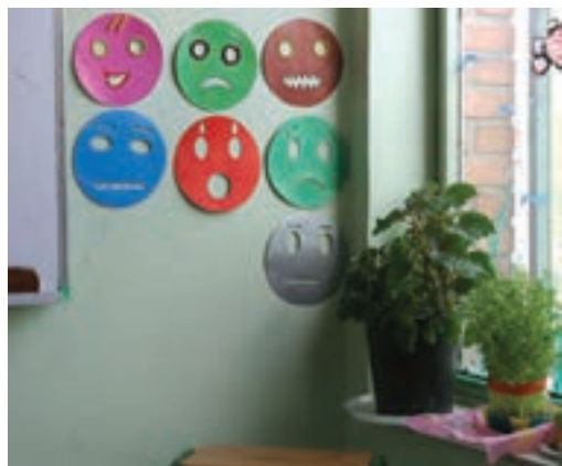
شکل ۲۱- قرار گرفتن گل و گیاه با توجه به منبع نور