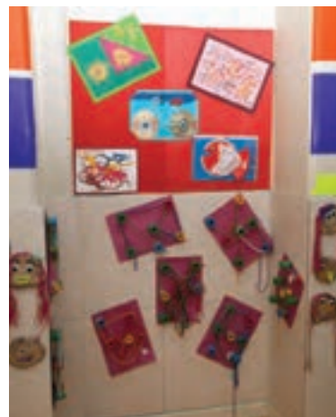
شکل ۱۰- نمایش کار کودکان روی دیوار