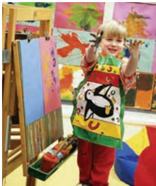
شکل ۷ - سه پایه نقاشی

■ نور مناسب و کافی از جمله مواردی است که باید به آن دقت شود، بهتر است این قسمت کنار پنجره باشد تا کودک علاوه بر نور طبیعی، بتواند آسمان، درختان و... را مشاهده کند.