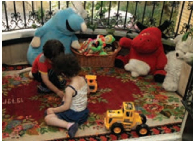
شکل ۱۸- محل خانه عروسکی

تأکید می‌شود بین مربی و کودک راه ارتباطی باید وجود داشته باشد به‌طور مثال در شکل ۱۸، این کودک در مرکز بین سایر وسایل قرار گرفته و مربی می‌تواند ناظر بر اجرا باشد، از طرفی کودک نیز می‌تواند به بازی دلخواه خود، حتی به تنهایی بپردازد.