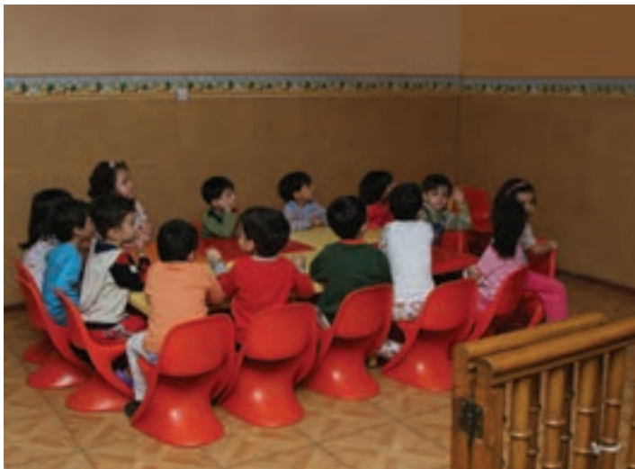
شکل ۱- دیوار خالی مهد کودک