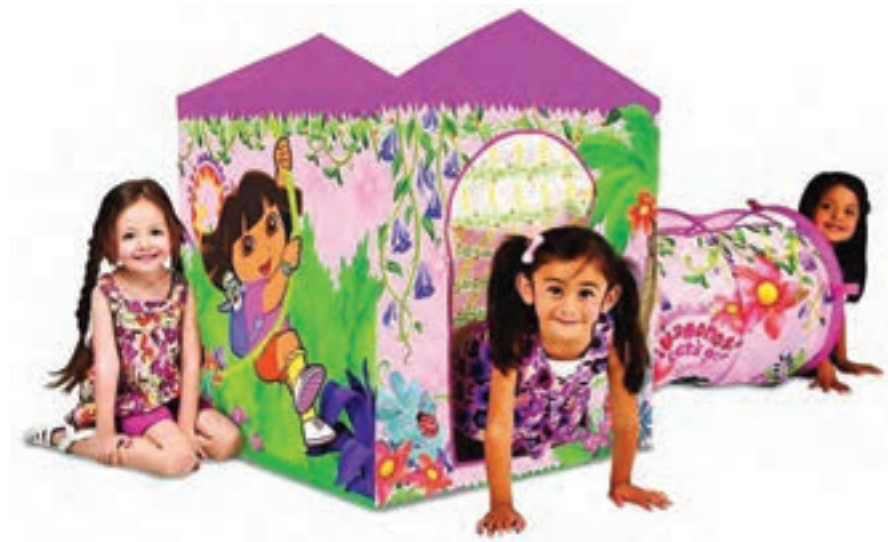
شکل ۱۵- خانه عروسکی درون چادر

■ در بعضی از مراکز از چادرهای آماده برای نیل به این هدف استفاده می‌شود. این چادرها به علت فضای کم، امکان تعامل راحتی برای دو کودک ایجاد نمی‌کند (شکل ۱۵).