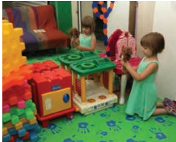
شکل ۱۷- کف پوش و آینه خانه عروسکی