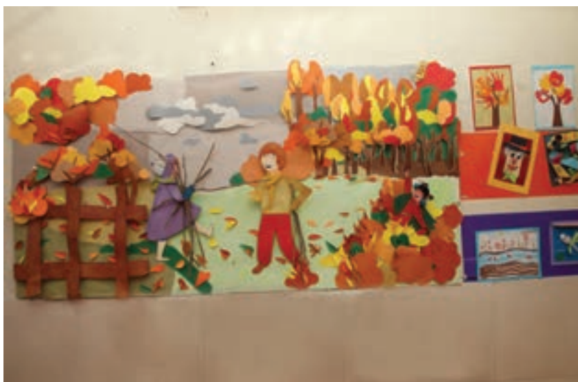
شکل ۲- دیوار با پوستر

لذا رعایت ایمنی در این مورد ضروری است. ارتفاع کلید و پریز از کف اتاق ۱۱۵ تا ۱۲۵ سانتی‌متر و حتماً باید از حفاظ استفاده شود. ■ رنگ‌های روشن دیوار، فضا را بزرگ‌تر و رنگ‌های تیره، فضا را کوچک‌تر می‌کنند.