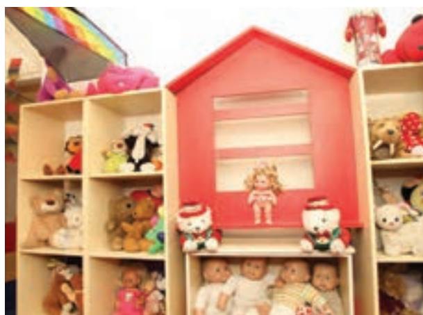
شکل ۱۶- وسایل خانه عروسکی