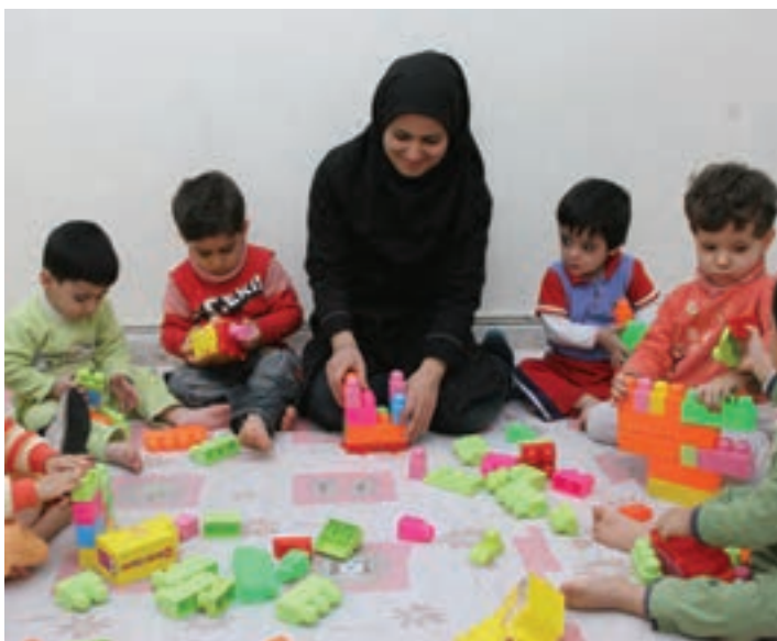
شکل ۵ - بازی با آجرک‌ها به صورت انفرادی و گروهی