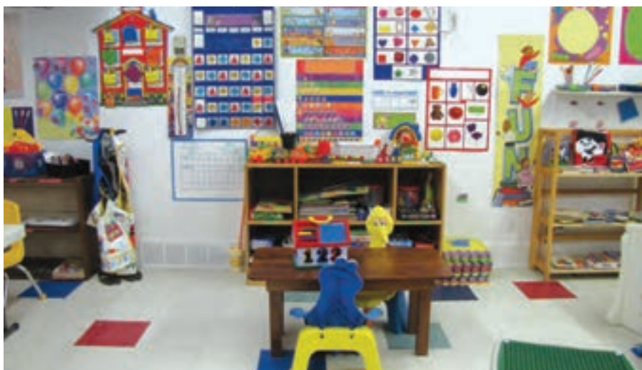
شکل ۲۲- مرکز فعالیت های ریاضی

علاقه مندی کودکان به اعداد و مفاهیم ریاضی، مانند طبقه بندی، درک شباهت ها و تفاوت ها، الگوبرداری و غیره در خلال تجاربشان حاصل می شود بنابراین تا رسیدن به مفاهیم ذهنی قابل درک با ایجاد فرصت هایی برای کسب تجارب دست اول می توان به آنها کمک کرد. آموزش ریاضی به کودکان شامل شمارش، اندازه گیری، شناخت اشکال و مقایسه مواردی است که به کودک برای نوشتن کمک می کند (شکل ۲۲).