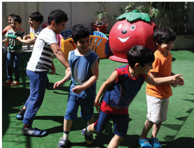
شکل ۱۰- بازی کودکان با یکدیگر