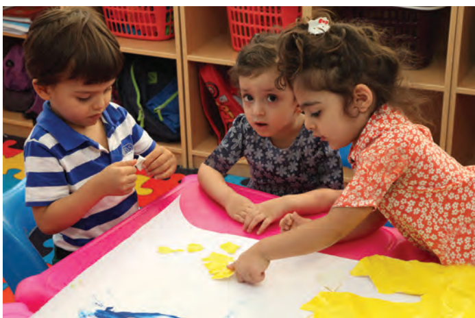
شکل ۱۱- درست کردن کاردستی

فعالیت ۲۰: در گروه‌های کلاسی با استفاده از وسایل دورریختنی عروسک درست کنید.