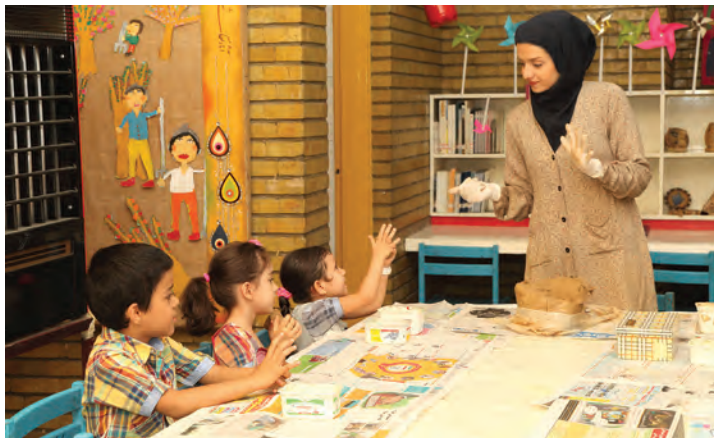
شکل ۱۹- فعالیت مشارکتی مربی با کودکان

۶ برنامه‌ریزی برای کودکان در انجام امور مرکز یا کلاس: دادن فرصت به کودکان در انجام امور مختلف کلاس می‌تواند باعث برانگیختن آنها برای مشارکت در فعالیتهای آموزشی شود برای مثال برنامه‌ریزی برای برگزاری نمایشگاه‌ها، جشن‌ها و امثال آن (شکل ۱۹).