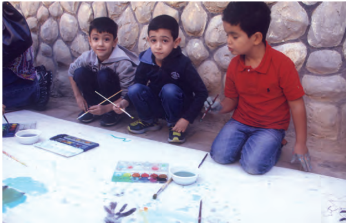
شکل ۱۲- نقاشی گروهی کودکان