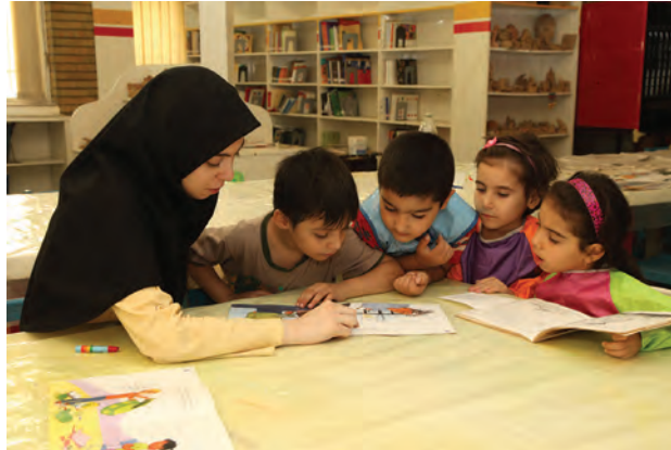
شکل ۱- ارتباط مربی با کودک

فعالیت ۱: در گروه‌های کلاسی با توجه به تصاویر بالا در مورد نقش ارتباط مربی با کودکان گفت‌وگو کنید و نتیجه را در کلاس ارائه دهید.