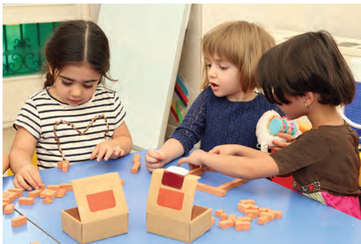
شکل ۱۴- مشارکت کودکان