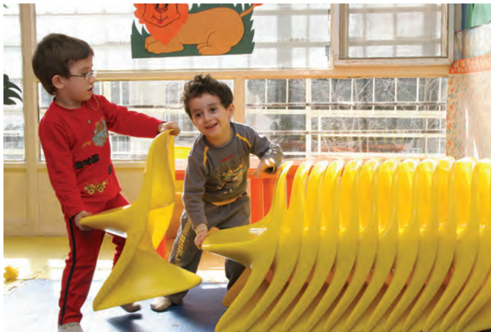
شکل ۴- پیامدهای مهارت‌های اجتماعی

افرادی که مهارت‌های اجتماعی ضعیفی دارند، در معرض روبه‌رو شدن با پیامدهای منفی شامل طرد شدن توسط همسالان، ظهور اختلال‌های روان‌شناختی، گوشه‌گیری و عملکرد تحصیلی پایین هستند.