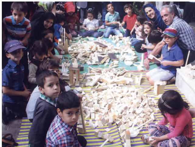
شکل ۱۷- فعالیت مشارکتی

۶ ت: تعادل در تقسیم کار: با تقسیم کار بین کودکان برای انجام فعالیت مشارکتی، شرح وظایف کودکان مشخص‌تر و تخصصی‌تر می‌شود، تداخل کاری به وجود نمی‌آید و توازن کار بین کودکان ایجاد می‌شود (شکل ۱۷).