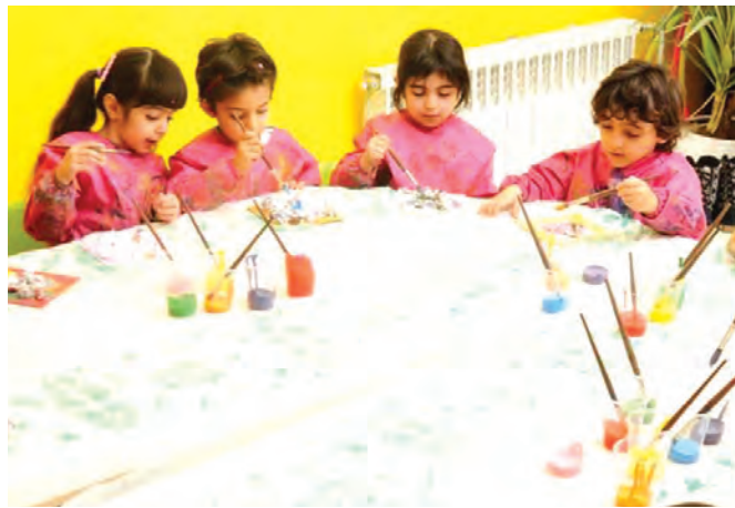
شکل ۱۸- مشارکت در انجام یک فعالیت گروهی

فعالیت ۳۲: به نظر شما برای موفقیت در والیبال هنرستان هر کدام از بازیکنان برای مشارکت گروهی مطلوب چه اصولی را باید رعایت کنند؟ با دوستان خود در این مورد گفت‌وگو کنید و نتیجه را در کلاس ارائه دهید.