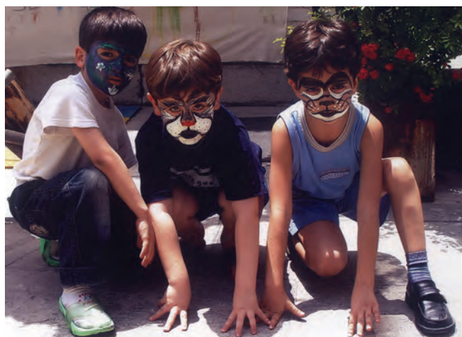
شکل ۸- نمایش کودکان

بعد از خواندن قصه می‌توان از کودکان خواست که نقش‌های قصه را وانمود کنند (ایفای نقش). این ایفای نقش به کودک کمک می‌کند علاوه بر شناخت خود و کاهش خود محوری، به درک و شناخت دیگران و احساسات آنها توجه کند. نمایش‌های کودکان با تعاون و همکاری همسالان او و نظارت مربی صورت می‌گیرد. فعالیت‌های پیشنهادی زیر در این زمینه می‌تواند مؤثر باشد: