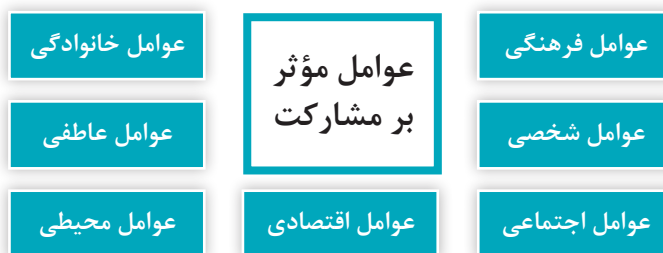
نمودار ۳- عوامل مؤثر بر مشارکت

یکی از عوامل فرهنگی روبه گسترش در اکثر جوامع، استفاده از ابزارهای مختلف فناوری ارتباطات و اطلاعات و ارتباط در دنیای مجازی است که بر میزان مشارکت مربی با کودک تأثیر می‌گذارد.