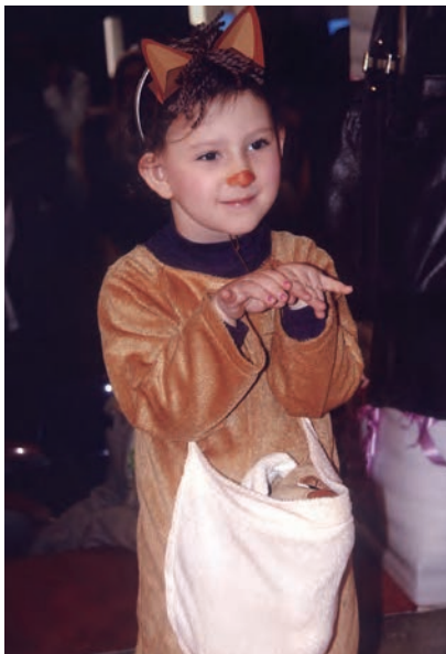
شکل ۹- شعرخوانی کودک