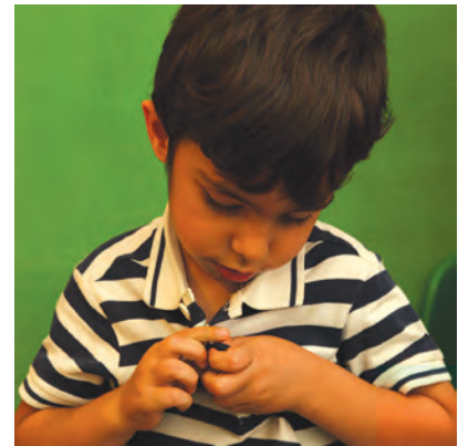
شکل ۵- انواع مهارت‌های اجتماعی کودک

فعالیت ۹: با توجه به تصاویر شکل ۵، در مورد انواع مهارت‌های اجتماعی کودک گفت‌وگو کنید و نتیجه را در کلاس ارائه دهید.