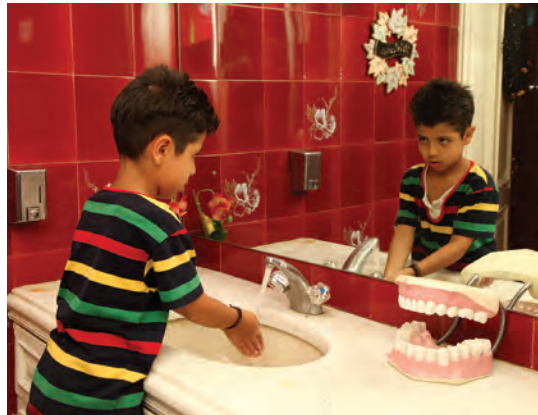
شکل ۳- مهارت‌های اجتماعی