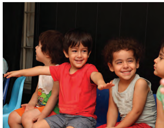
شکل ۱۵- بازی مشارکتی کودکان

فعالیت ۲۵: در گروه‌های کلاسی، هر کدام یک نمونه از فعالیت مشارکتی را که در گذشته تجربه کرده‌اید بیان کنید و دلایل رضایت و یا نارضایتی خود را از این فعالیت مشارکتی، در کلاس ارائه دهید.