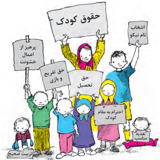
شکل ۲۰- حقوق کودکان در اسلام

اینکه این حمایت‌ها از حقوق کودکان، زمانی مطرح شده که هیچ نهاد، سازمان یا کنوانسیون بین‌المللی برای دفاع از حقوق کودکان وجود نداشته است. اسلام با در نظر گرفتن همه نیازهای اولیه جسمی، روحی و روانی کودکان و دفاع از آن، زمینه را برای رشد و پیشرفت آنان در همه جنبه‌ها فراهم آورده است (شکل ۲۰) از جمله این حقوق می‌توان به موارد زیر اشاره کرد: