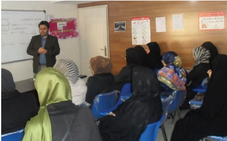
شکل ۲۱- برگزاری کارگاه آموزشی والدین

۴ کارگاه‌های آموزشی برای والدین، مربیان، و کلیه دست‌اندرکاران مرکز آموزشی توسط اساتید برگزار گردد (شکل ۲۱).