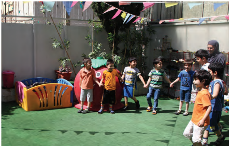
شکل ۶- مهارت‌های بین فردی کودکان