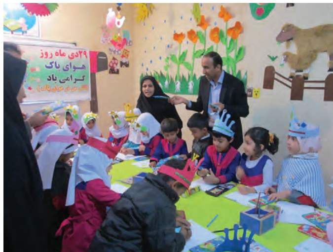
شکل ۱۶- مشارکت مربی با کودکان

بسیاری از کارشناسان و اندیشمندان و متفکران کشورمان به این نتیجه رسیده‌اند که حل بسیاری از معضلات جامعه جهانی با مشارکت سازمان‌ها و جوامع امکان‌پذیر است.