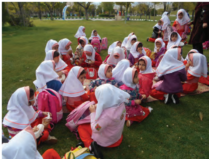
شکل ۱۳- گردش علمی کودکان