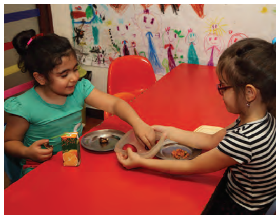
شکل ۲- مهارت‌های اجتماعی کودک

فعالیت ۶: در گروه‌های کلاسی در مورد پیام‌های شکل ۲ و عوامل مؤثر در ارتباط کودک با کودک گفت‌وگو کنید و نتیجه را در کلاس ارائه دهید.