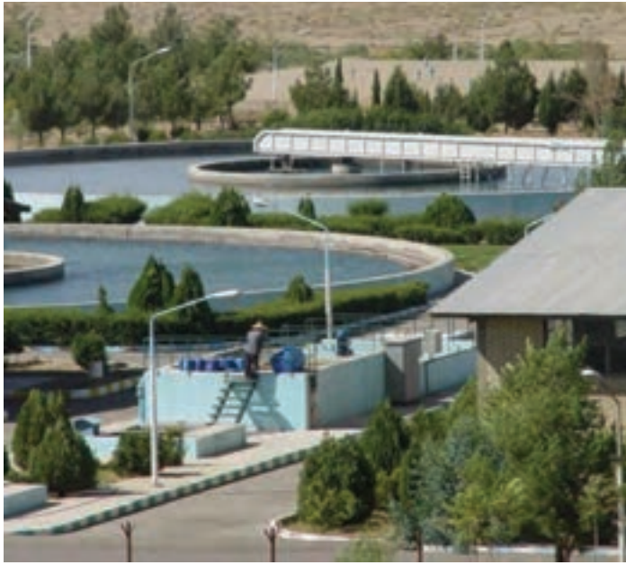
شکل ۳۲-۱- تصفیه‌خانه سد ۱۵ خرداد

«دودهک» احداث شده است. آب تصفیه‌خانه قم از سد ۱۵ خرداد تأمین و توسط لوله به تصفیه‌خانه منتقل می‌شود. در این تصفیه‌خانه، سالانه حدود ۷۰ میلیون مترمکعب آب تصفیه شده به شهر قم منتقل می‌شود (شکل ۳۲-۱).