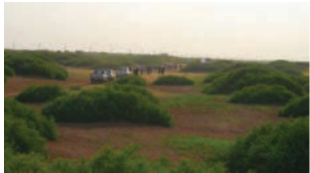
شکل ۳۲-۱- چشم اندازی از گیاه قره داغ کویر میقان