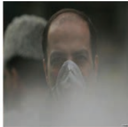
شکل ۳۷-۱- آلودگی هوا در شهر اراک (آذرماه ۸۹)