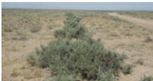
شکل ۳۰-۱- کاشت گیاه آتریپلکس

به منظور جلوگیری از روند بیابانی شدن زمین‌ها و سامان بخشیدن به بهره‌برداری از اراضی بیابانی و کویری و بهبود آنها اداره کل منابع طبیعی استان اقدام به بیابان‌زدایی کرده است؛ مهم‌ترین این اقدامات عبارت‌اند از: بوته‌کاری، بذرکاری، بذرپاشی، ایجاد بادشکن، قرق و حفاظت خاک.