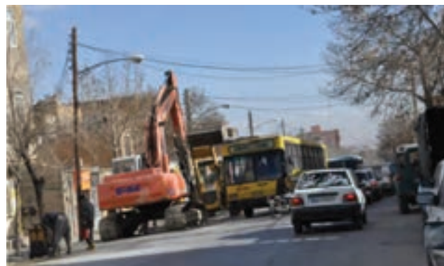
شکل ۴۳-۱- آلودگی صوتی در شهر اراک