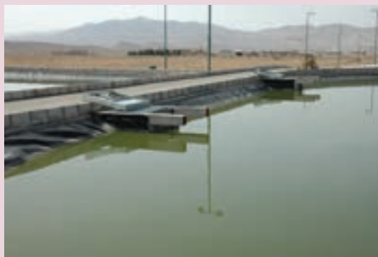
الف- برکه تثبیت در دلجان