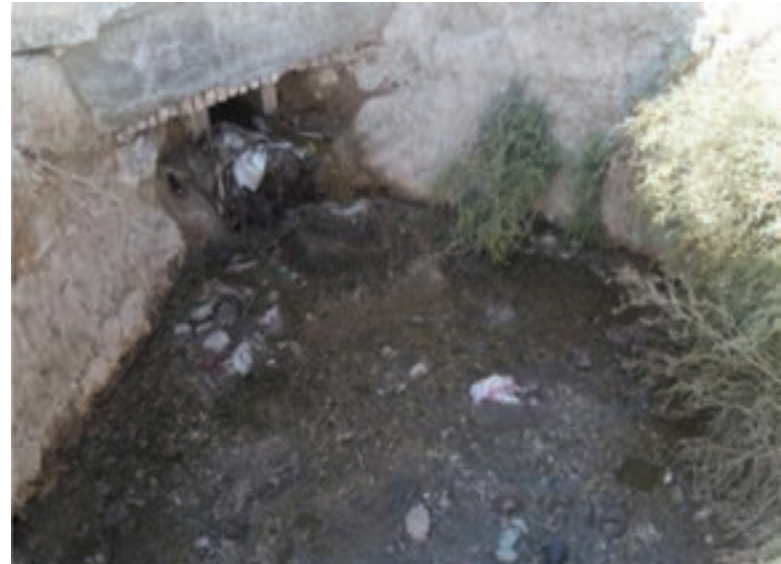
شکل ۳۹-۱- آلودگی آب رودها