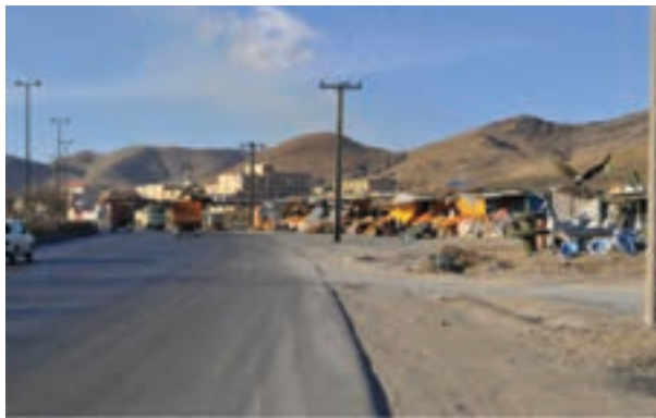
شکل ۴۲-۱- آلودگی بصری (محور اراک - سنجان)

آلودگی بصری مفهومی جدید است که البته از دیر باز وجود داشته است. در سطح شهرهای استان مرکزی عناصر بصری ناهمگون با محیط پیرامون و یا انباشت تعداد زیادی از این عناصر در یک منطقه دیده می شود؛ بیلبردها، تخریب های طبیعی، دکل های فشار قوی برق و... نمونه هایی از این موارد محسوب می شوند. از دلایل ایجاد این آلودگی در شهر اراک تقدم شهرنشینی بر شهرسازی، مهاجرت روستاییان و عدم رعایت حقوق شهروندی توسط عده ای از شهرنشینان است.