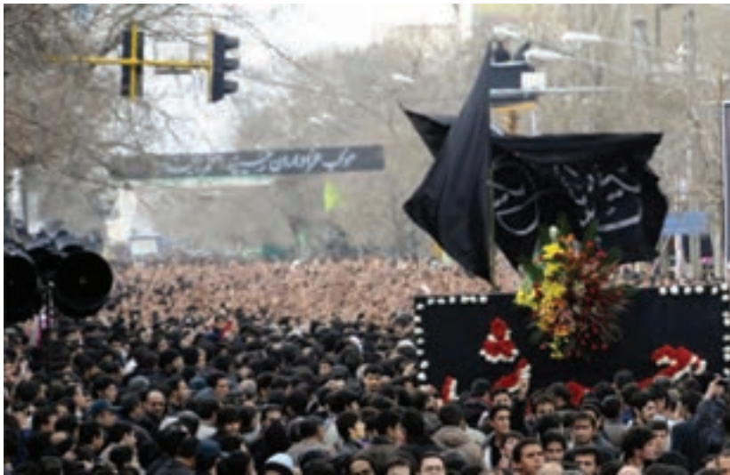
شکل ۳-۶- مراسم عزاداری حسینیه اعظم زنجان

و خیل عظیمی از شیعیان جهان نظاره‌گر آن هستند. این مراسم در اسفند سال ۱۳۸۷ (هشتم محرم سال ۱۴۳۰ هجری قمری) به‌عنوان دهمین میراث معنوی کشور به ثبت ملی رسیده است. شبییه‌خوانی یا تعزیه: نوع دیگری از عزاداری‌های رایج در استان است که مردم استان در شهرها و خصوصاً در اکثر روستاها با اجرای آن به عزاداری ائمه اطهار علیهم السلام می‌پردازند. شهر ارمغان‌خانه در اجرای تعزیه در استان شهرت خاصی دارد.