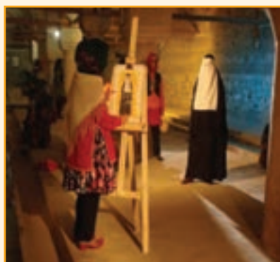
شکل ۳-۴- نمونه‌ای از لباس‌های محلی استان