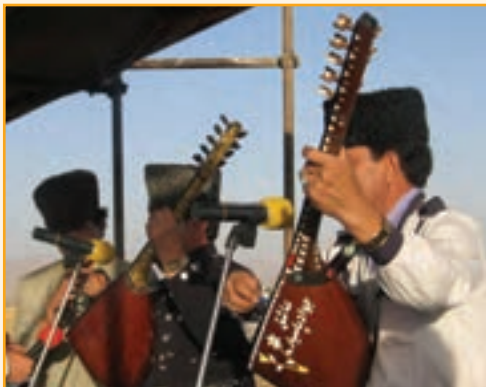
شکل ۵-۳- موسیقی محلی استان

موسیقی بومی استان زنجان از گنجینه موسیقی فولکلوریک و کلاسیک آذری تأثیر پذیرفته است و در حال حاضر نیز وجه غالب ترکیب موسیقی بومی، به‌ویژه مناطق روستایی استان را تشکیل می‌دهد. پیوستگی فرهنگی و قومی مردم استان با مردم آذری زبان از یک‌سو و ارتباط آن با منطقه‌هایی، غیر از زبان آذری از سوی دیگر، زمینه شکل‌گیری نوعی از موسیقی محلی ویژه را فراهم آورده است، که به موسیقی زنجانی معروف