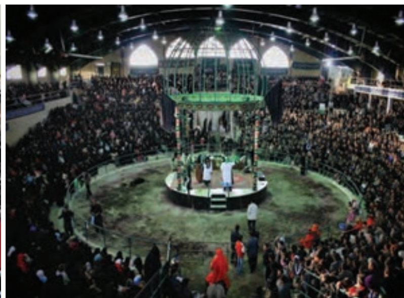
شکل ۳-۷- مراسم تعزیه در شهر ارمغان‌خانه