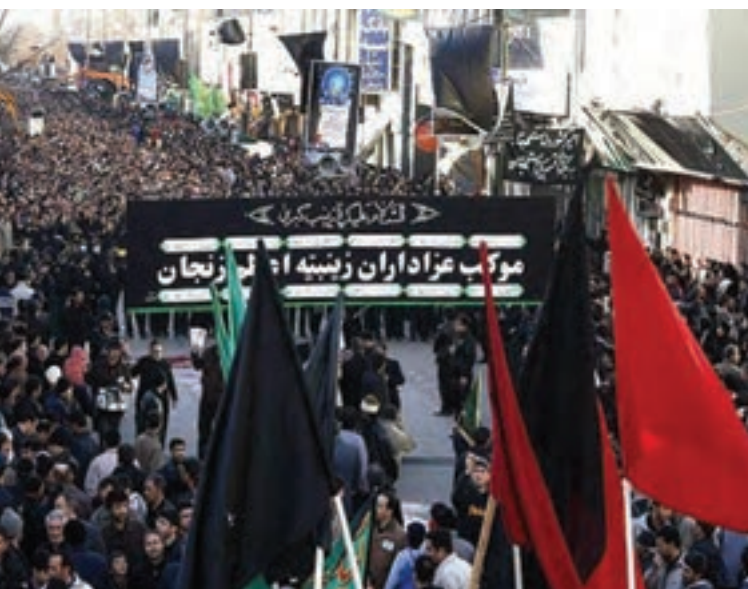
شکل ۳-۸- عزاداری زینبیه اعظم زنجان