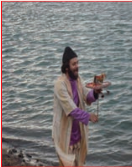
شکل ۲-۳- نمایش تکم گردانی