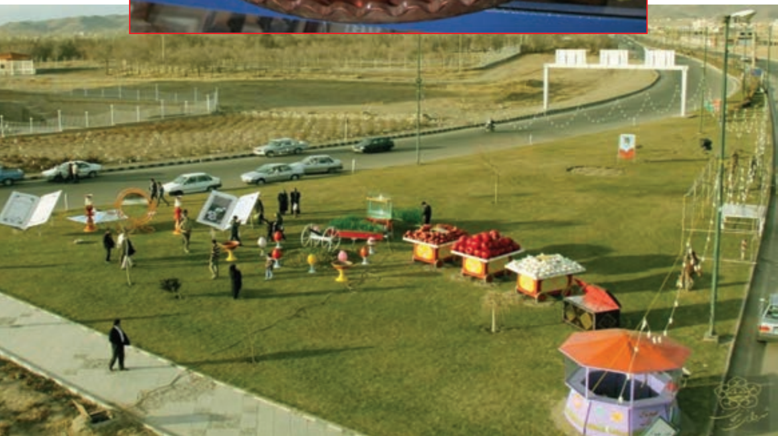
شکل ۱-۳- سفره هفت سین همراه با صنایع دستی بومی استان