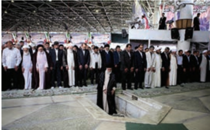
شکل ۱۶-۴- نماز جمعه تهران به امامت حضرت آیت الله خامنه‌ای رهبر معظم انقلاب اسلامی

مردم تهران نه تنها در صحنه دفاع حضور فعال داشتند بلکه با تشکیل ستاد معین بازسازی، همچنان حضور خود را در صحنه حفظ کردند و در زمینه آبادسازی مناطق آزاد شده به خصوص خرمشهر، به تلاش‌های خود ادامه دادند.