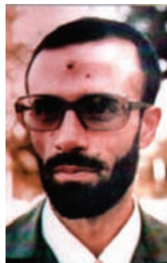
شکل ۸-۴- شهید کلاه‌دوز