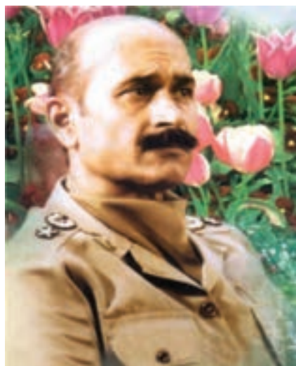
شکل ۱۰-۴- شهید فلاهی

در این میان می‌توان از مساجد به عنوان مهم‌ترین پایگاه جذب نیرو نام برد؛ به طوری که اولین پایگاه‌های بسیج نیز در مساجد شکل گرفت. وجه مشترک تمامی نیروهای داوطلب، ارتباط با مساجد و پایگاه‌های بسیج محلات بود که مساجد نقش اصلی پشتیبانی خطوط نبرد را نیز بر عهده داشتند و مطمئن‌ترین و آسان‌ترین راه کمک‌رسانی مردم به جبهه‌ها محسوب می‌شدند. ترویج فرهنگ ایثار و شهادت که ریشه در مذهب و بویایی مساجد داشت نیز موجب تداوم این فعالیت‌ها می‌شد و هر فردی که شهید می‌شد، ضمن آنکه همگی در مراسم تشییع آن شهید حضور فعال داشتند، از نظر روحی نیز ضربه مهلکی بر دشمنان وارد می‌آوردند و افراد بیشتری را راهی جبهه‌های نبرد حق علیه باطل می‌کردند که در آن، حضور جوانان بسیار چشمگیر بود. از دیگر کمک‌های مردمی به رزمندگان علاوه بر اهدای کالا، می‌توان به اهدای خون نیز اشاره کرد. مردم هر وقت احساس می‌کردند به خون آن‌ها نیاز است، دریغ نمی‌کردند. همچنین، آنان با شرکت فعال در راهپیمایی‌ها به مناسبت‌های مختلف، به رغم بمب‌گذاری‌ها و حملات هوایی دشمن، موجب تقویت روحیه رزمندگان می‌شدند و دشمنان را مأیوس می‌کردند.