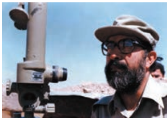
شکل ۱۱-۴- شهید دکتر مصطفی چمران