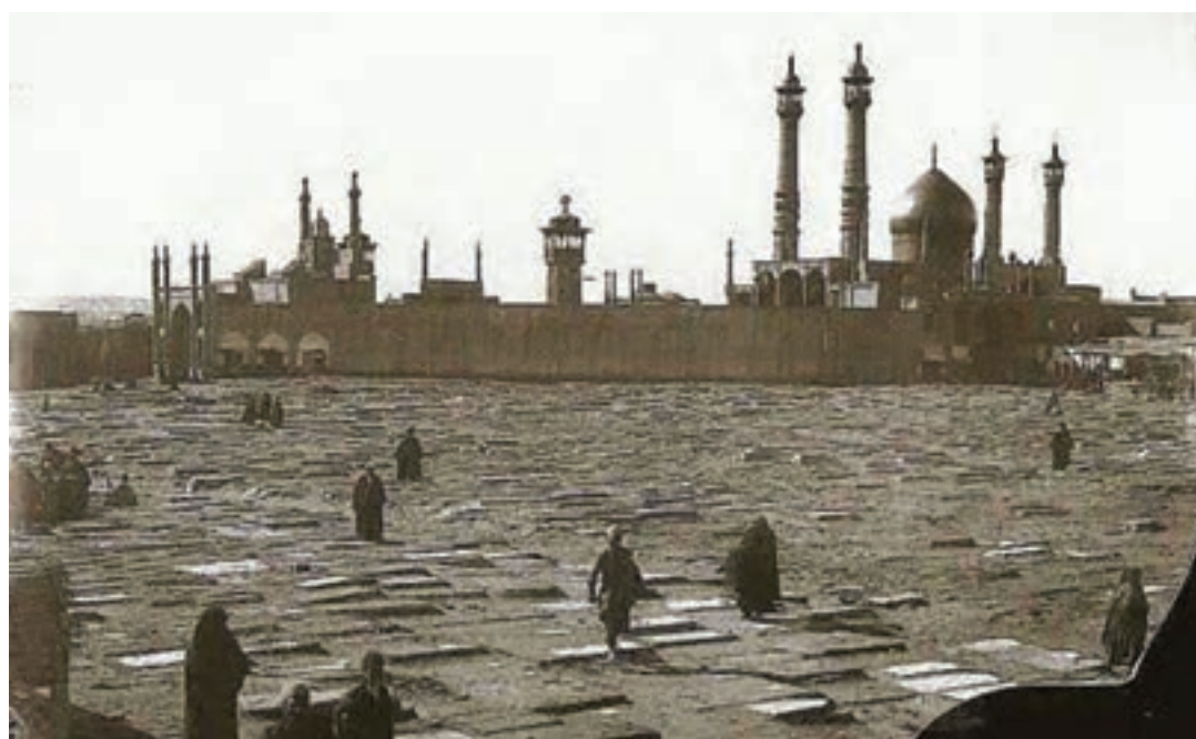
شکل ۲-۴- تصویر تاریخی از حرم مطهر حضرت معصومه (س)

در دوران سلطنت پهلوی دوم، قم به سنگر مبارزه فکری و مذهبی علیه سیاست‌های ضد مذهبی حکومت تبدیل شد. اولین جرقه انقلاب اسلامی در بهمن سال ۱۳۴۱ در شهر مقدس قم زده شد. مخالفت‌های علما و در رأس آنها حضرت امام خمینی (ره) با لایحه انجمن‌های ایالتی و ولایتی، رفراندوم اصول ششگانه انقلاب شاه و لایحه کاپیتولاسیون، شهر قم را به پایگاه مبارزه علیه رژیم محمد رضا پهلوی تبدیل کرد.