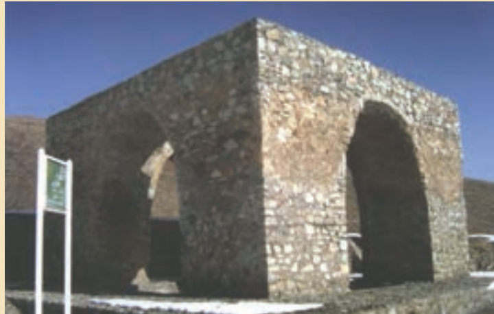
شکل ۷-۴- چهار طاقی (آتشکده) نویس در غرب استان

۲- چهار طاقی یا آتشکده : چهار طاقی یا آتشکده از آثار به جای مانده دوران پیش از اسلام در سرزمین قم است که معروفترین آنها چهار طاقی نویس (شکل ۷-۴) واقع در بخش خلجستان (روستای نویس) و چهار طاقی کزیمجان واقع در جنوب استان قم (در روستای کرمجان) است که هر دو مربوط به عصر ساسانی است.