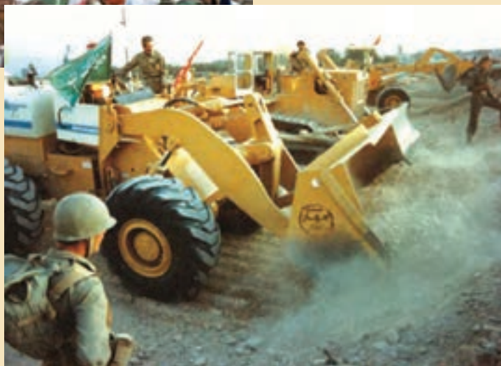
شکل ۱۵-۴- نقش جهادسازندگی در هشت سال دفاع مقدس