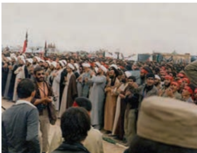
شکل ۱۴-۴- اعزام طلاب به جبهه