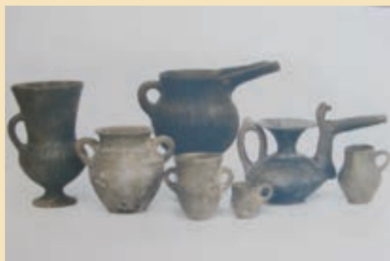
شکل ۴-۵- آثار کشف شده در تپه تاریخی صرم