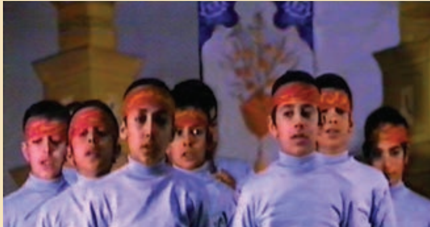
شکل ۱۶-۴ گروه سرود مدرسه قطب راوندی ساعتی قبل از شهادت