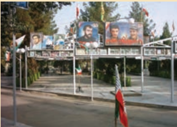
شکل ۴-۱۲- گلزار شهدای قم

در طول جنگ حدود ۵۰/۰۰۰ نفر از استان قم به جبهه‌های نبرد اعزام شدند. از این تعداد، حدود ۶۰۰۰ نفر از رزمندگان قمی به شهادت رسیدند، ۱۲۷۰۰ نفر به افتخار جانبازی نائل آمدند و ۵۴۰ نفر نیز از آزادگان سرافرازند.