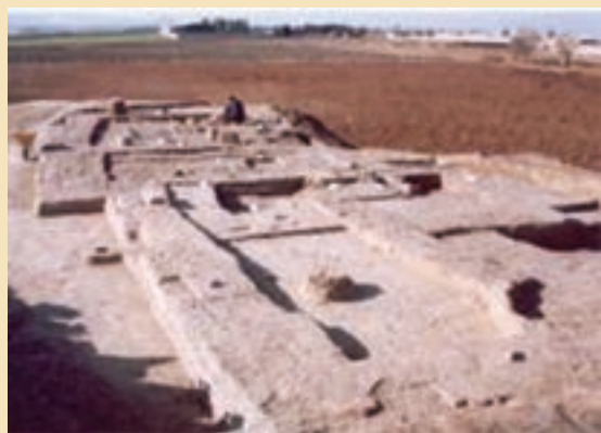
شکل ۴-۴- تپه تاریخی قلی درویش