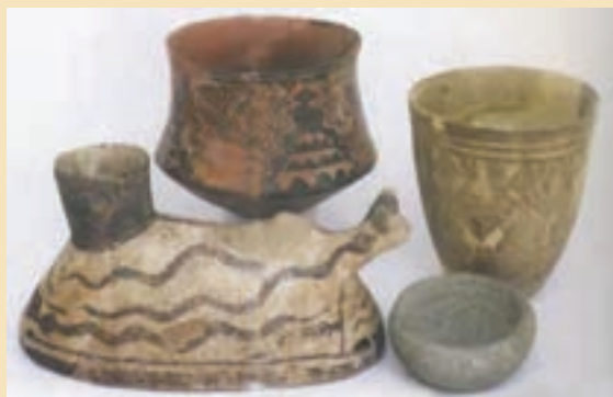
شکل ۴-۶- آثار کشف شده در قره تپه قمرود

ظروف از سفال‌های آجری و نخودی رنگ استفاده می‌کردند اما با ورود آریایی‌ها، سفالینه‌های خاکستری جایگزین آنها شد.