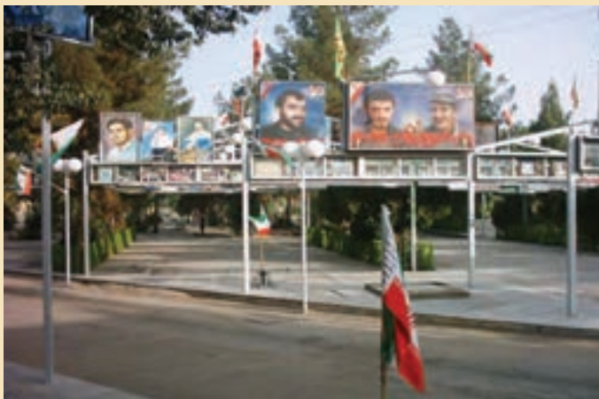
شکل ۱۸-۴- گلزار شهدای امام زاده علی بن جعفر علیه السلام قم

شهدای گمنام : یکی از مکان‌هایی که مورد بازدید و زیارت مردم قم و زائران حرم مطهر حضرت معصومه (س) قرار می‌گیرد مرقد پاک و مطهر ۱۴ شهید گمنام در محل کوه خضر نبی (ع) است. این شهدا که در پایین کوه خضر به خاک سپرده شده‌اند یکی از میعادگاهها و زیارتگاههای مردم به‌شمار می‌رود که در هفته به‌خصوص شب‌های جمعه پذیرای تعداد زیادی از زائران و هم‌زمان شهدا و مردم استان و دیگر مناطق کشور است.