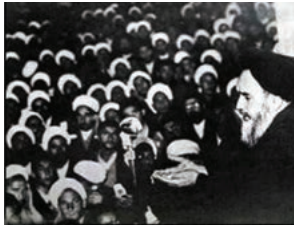
شکل ۳-۴- سخنرانی پرشور امام خمینی (ره) در ۱۲ خرداد سال ۱۳۴۲

پس از پیروزی شکوهمند انقلاب اسلامی ایران، شهر قم به پایتخت مذهبی کشور تبدیل شده است و علما و مردم آگاه قم در تحولات سیاسی کشور نقش مهمی ایفا می‌کنند و همواره پشتیبان برنامه‌ها و اهداف انقلاب اسلامی هستند.