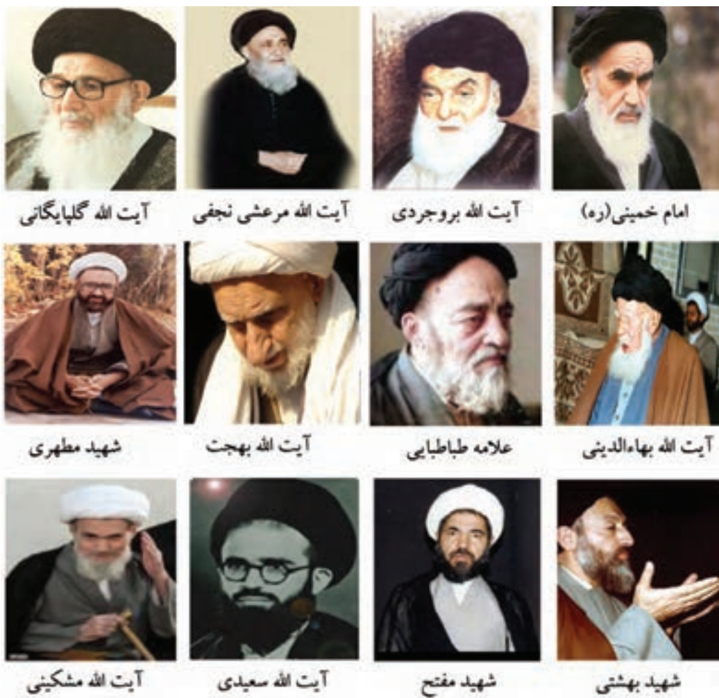
شکل ۹-۴- تصاویری از برخی شخصیت‌های بزرگ علمی و انقلابی استان قم در دوره معاصر

در دوره معاصر، بزرگان زیادی در این سرزمین مقدس زندگی کرده‌اند که به چند نفر از آنها اشاره می‌شود: حضرت امام خمینی (ره) بنیان‌گذار جمهوری اسلامی ایران، آیت الله حاج شیخ عبدالکریم حائری مؤسس حوزه علمیه قم، علامه محمد حسین طباطبایی صاحب تفسیر ارزشمند المیزان، آیت الله مرعشی نجفی، آیت الله بروجردی، آیت الله گلپایگانی، آیت الله خوانساری، آیت الله بهاء‌الدینی، آیت الله اراکی، آیت الله صدر، آیت الله بهجت، آیت الله مشکینی و استاد علی اصغر فقیهی معلم و پژوهشگر برجسته. گفتنی است شهید مفتح، شهید مرتضی مطهری، شهید بهشتی، شهید آیت الله سعیدی و شهید حسین غفاری در راه پیروزی انقلاب اسلامی، به شهادت رسیدند.