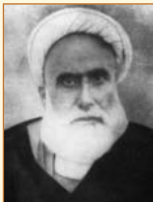
حاج شیخ عباس قمی

– قاضی احمد قمی نویسنده کتاب «خلاصة التواریخ».