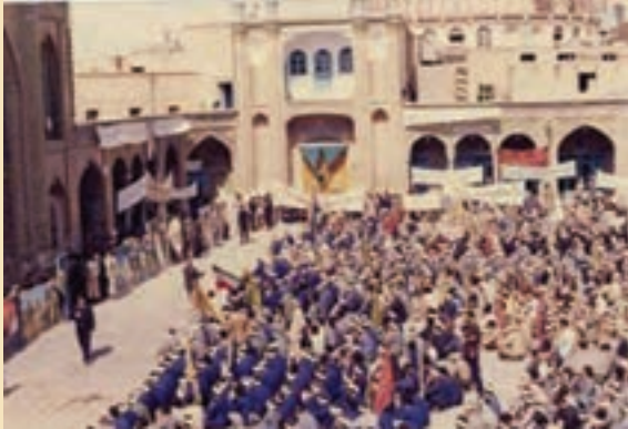
شکل ۴-۱۱- عزیمت رزمندگان روحانی به جبهه‌ها