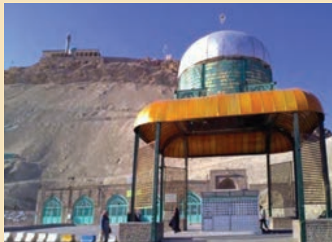
شکل ۱۹-۴- مرقد مطهر شهدای گمنام استان در دامنه کوه خضر نبی (ع)

شهدای گمنام : یکی از مکان‌هایی که مورد بازدید و زیارت مردم قم و زائران حرم مطهر حضرت معصومه (س) قرار می‌گیرد مرقد پاک و مطهر ۱۴ شهید گمنام در محل کوه خضر نبی (ع) است. این شهدا که در پایین کوه خضر به خاک سپرده شده‌اند یکی از میعادگاهها و زیارتگاههای مردم به‌شمار می‌رود که در هفته به‌خصوص شب‌های جمعه پذیرای تعداد زیادی از زائران و هم‌زمان شهدا و مردم استان و دیگر مناطق کشور است.