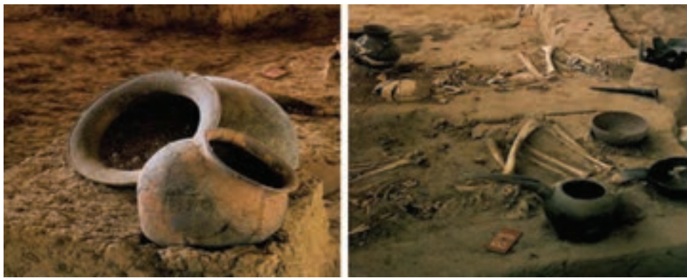
شکل ۱-۴- نمونه هایی از آثار به دست آمده در گوهر تپه

در سراسر جلگه های مازندران تپه های باستانی وجود دارند که برخی از آنها با نام های عمومی و محلی «دین» شناخته می شوند. برخی از آنها توسط باستان شناسان مورد کاوش قرار گرفته اند. یکی از این تپه های معروف «گوهر تپه»، در شهرستان بهشهر است. در حفاری های گوهر تپه شواهدی از ساختارهای معماری با دیوارهای خشتی و سنگی، تدفین مردگان به شکل ساده و قرار دادن اشیاء در کنار آنها، سفال، پیکرک انسانی و حیوانی، صنایع سنگی از جمله مهر و اشیایی از جنس مفرغ و آهن از جمله خنجر، لوازم آرایشی و دوک نخ ریزی به دست آمده است.