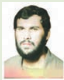
شهید محمدحسن قاسمی طوسی

علمدار لشکر ویژه ۲۵ کربلا، سردار سرلشکر شهید محمد حسن قاسمی طوسی :