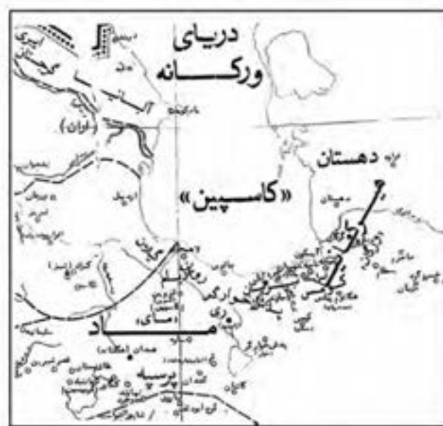
شکل ۲-۴- مازندران در دوره ساسانیان