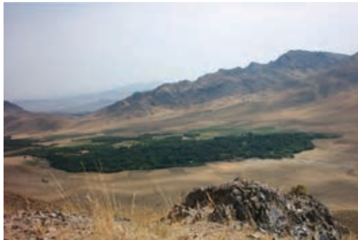
شکل ۲۵-۵- منطقه زیبای درباغ در بخش کهک

۴- منطقه ییلاقی خلیجستان : این منطقه با داشتن آب و هوای معتدل و وجود روستاهای بسیار زیبا مانند قاهان و ونان یکی از مناطق زیبای ییلاقی استان قم است. وجود باغ‌های زیبا، کوه‌های مرتفع و قرار گرفتن در مسیر راه قم به ساوه و قم به تفرش سبب شده تا گردشگران بسیاری از این منطقه دیدن کنند.