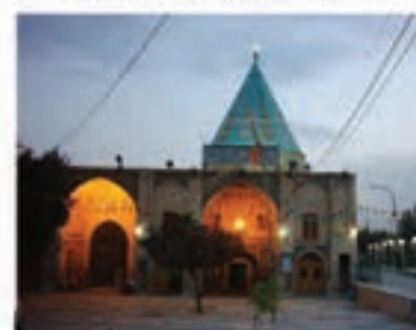
امامزاده علی ابن جعفر