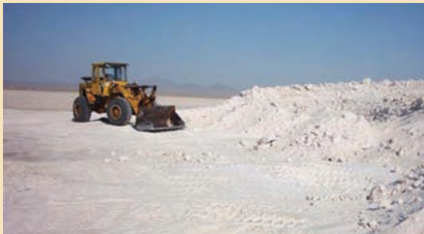
شکل ۳-۵- استخراج نمک از دریاچه حوض سلطان

معادن دریاچه نمک قم و حوض سلطان: دریاچه نمک قم به عنوان منبع عظیم و سرشار انواع املاح معدنی طی سالیان اخیر مورد توجه و مطالعه قرار گرفته است. نتایج طرح مطالعه، بیانگر وجود ۲۰ میلیون تن منیزیم در دریاچه است که کاربردی مؤثر در صنایع نسوز دارد. علاوه بر منیزیم از شورابه‌ها حدود ۱۲ کانی می‌توان به دست آورد، که کاربردهای متنوعی در صنایع گوناگون نظیر کودهای شیمیایی، کاغذ، عایق کاری لوله، ضد یخ و ... دارند. در دریاچه حوض سلطان نیز انواع نمک‌های خوراکی و صنعتی وجود دارد که هم‌اکنون استخراج می‌شود.