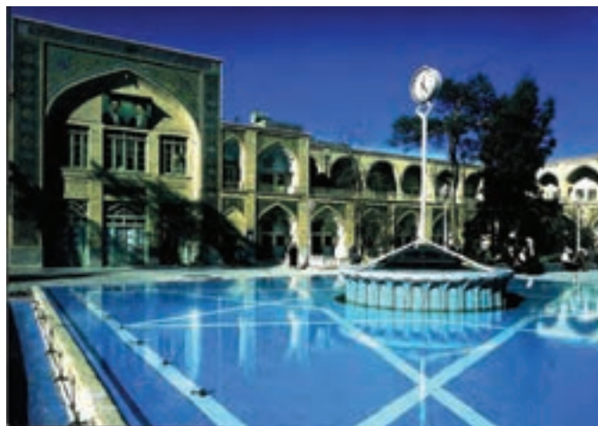
شکل ۳۴-۵- مدرسه فیضیه قم

— مدرسه فیضیه : مدرسه فیضیه یکی از پرآوازه‌ترین حوزه‌های علوم دینی در جهان اسلام است. این مدرسه از نیمه اول قرن سیزدهم هجری جایگزین بنای «مدرسه آستانه» شده و به اعتبار متون معتبر تاریخی از اواسط قرن ششم هجری قمری وجود داشته است. این مدرسه دارای چهار ایوان بوده و در دو طبقه با ۴۰ حجره تحتانی متعلق به عصر قاجار و ۴۰ حجره فوقانی متعلق به قرن چهاردهم هجری قمری است که با هدایت حضرت آیت الله حائری یزدی (ره) بر فراز حجره‌های پیشین در گرداگرد حیاط مرکزی بنا شد. قدیمی‌ترین بخش مدرسه، ایوان جنوبی آن است که مزین به کاشی‌کاری‌های زیبای معرق است. این ایوان طرف قبله و متصل به حرم مطهر است و سر در صحن عتیق حضرت فاطمه معصومه (س) از طرف فیضیه محسوب می‌شود. مدرسه فیضیه در شکل‌گیری و پیروزی انقلاب اسلامی نقش مهمی داشته است.