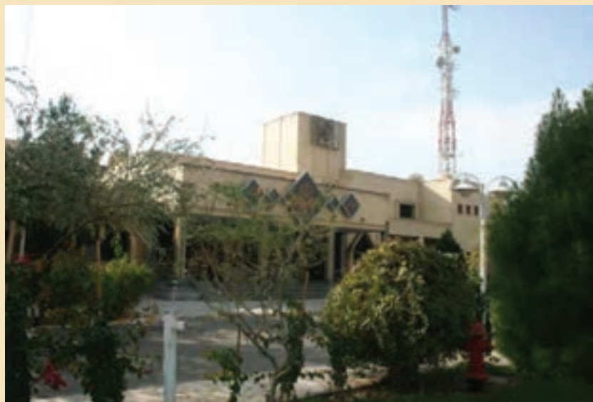
شکل ۳۷-۵- صدا و سیمای مرکز قم

ث) صدا و سیما: شهر مقدس قم به سبب آنکه مرکز معنوی جهان تشیع و خاستگاه انقلاب اسلامی ایران محسوب می‌شود و نیز به برکت بارگاه ملکوتی کریمه اهل بیت (س) و مسجد مقدس جمکران از جایگاه ممتاز معنوی و فرهنگی برخوردار است. از این رو صدا و سیمای مرکز قم باید در شأن این شهر مقدس باشد. نقش صدا و سیمای مرکز قم به مراتب فراتر از یک شبکه استانی است. در مرکز قم علاوه بر برنامه‌سازی برای بیش از یک میلیون و چهل هزار نفر جمعیت استان قم از چشمه جوشان اهل بیت (ع) در این شهر به نفع شبکه‌های ملی و فراملی استفاده کرده و برنامه‌های مورد نیاز صدا و سیما را در حوزه معارف دینی تولید می‌کند. این ویژگی صدا و سیمای مرکز قم، ویژگی منحصر به فردی است و هیچ‌یک از مراکز صدا و سیما این شرایط خاص را ندارد. رادیو سراسری معارف از این استان پخش می‌شود.