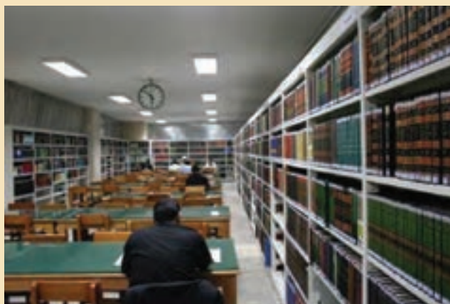
شکل ۳۶-۵- کتابخانه آیت الله مرعشی نجفی

کتابخانه آیت الله مرعشی نجفی: این کتابخانه، یکی از غنی ترین کتابخانه های جهان تشیع است که با همت آیت الله مرعشی نجفی (ره) تأسیس شد. این کتابخانه دارای گنجینه ای با ارزش از نسخه های خطی نفیس بالغ بر ۶۵۰۰۰ عنوان است که بسیاری از آنها در جهان همتا ندارند و غالباً توسط دانشمندان مسلمان در سده های سوم و چهارم (بیش از هزار سال پیش) به زبان های مختلف نوشته شده اند و هم چنین، نزدیک به یک میلیون جلد کتاب های چاپی دارد. این کتابخانه نخستین کتابخانه کشور از نظر نسخه های خطی و سومین کتابخانه جهان اسلام به شمار می رود.