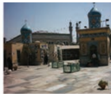
مقبره میرزای قمی و ذکریا ابن آدم