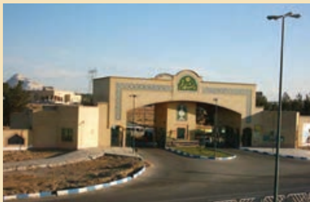
شکل ۳۵-۵- دانشگاه قم

پ) کتابخانه ها: در حال حاضر، در شهر قم کتابخانه های بزرگ و مهمی مانند کتابخانه آیت الله مرعشی نجفی، کتابخانه دفتر تبلیغات اسلامی حوزه علمیه قم، کتابخانه مدرسه فیضیه، کتابخانه مسجد اعظم، وجود دارد که در این میان، کتابخانه آیت الله مرعشی نجفی (ره) دارای اهمیت جهانی است.