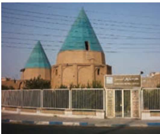
شکل ۵-۵- مقابر گنبد سبز