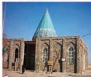
امامزاده طیب و طاهر