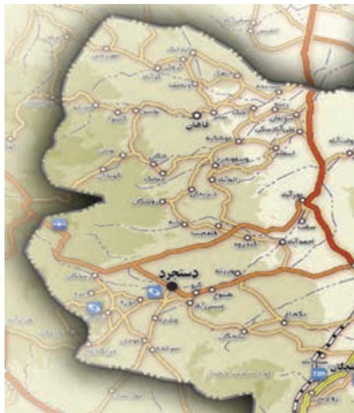
شکل ۲۶-۵- نقشه منطقه ییلاقی خلیجستان

۴- منطقه ییلاقی خلیجستان : این منطقه با داشتن آب و هوای معتدل و وجود روستاهای بسیار زیبا مانند قاهان و ونان یکی از مناطق زیبای ییلاقی استان قم است. وجود باغ‌های زیبا، کوه‌های مرتفع و قرار گرفتن در مسیر راه قم به ساوه و قم به تفرش سبب شده تا گردشگران بسیاری از این منطقه دیدن کنند.