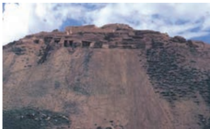
شکل ۱۱-۵- قلعه باستانی زیویه

● قلعه باستانی زیویه : این قلعه در ۴۵ کیلومتری شرق سقز و در شمال روستای زیویه واقع شده است. قلعه زیویه هم از نظر معماری و هم از نظر آثار هنری یکی از شاخص ترین مکان های تاریخ ایران باستان محسوب می شود و مربوط به اقوام مان نایی