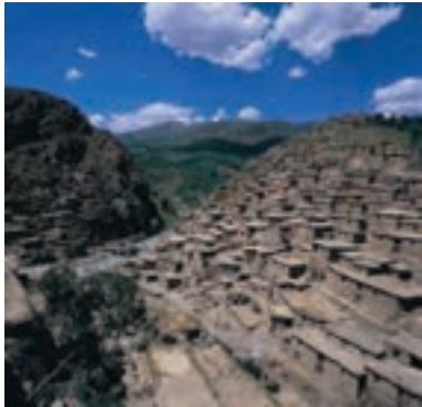
شکل ۲۰-۵- روستای تاریخی پالنگان