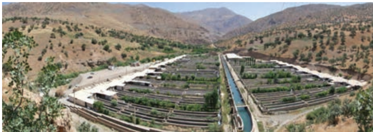
شکل ۳۱-۵- مجتمع پرورش ماهی سردآبی پالنگان