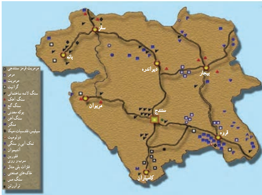
شکل ۳۵-۵ نقشه پراکنندگی معادن مهم استان

استان کردستان با ۱۹۹ معدن فعال، ذخیره قطعی ۳۸۶ میلیون تن و استخراج سالیانه ۴/۵ میلیون تن مواد معدنی یکی از قطب های معدنی کشور محسوب می شود. این استان از نظر تنوع و میزان کانسارهای معدنی بسیار غنی است؛ به طوری که ذخیره و منابع معدنی شناسایی شده و در حال بهره برداری استان، بسیار فراوان است و موارد مهم آن عبارتند از: سنگ آهن، طلا، سیلیس، فلدسپات، خاک صنعتی، میکا، انواع سنگ های تزئینی، سنگ آهک، نمک، پوکه معدنی، سنگ گچ و ... .