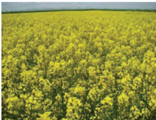
شکل ۲۸-۵- مزرعه کلزا