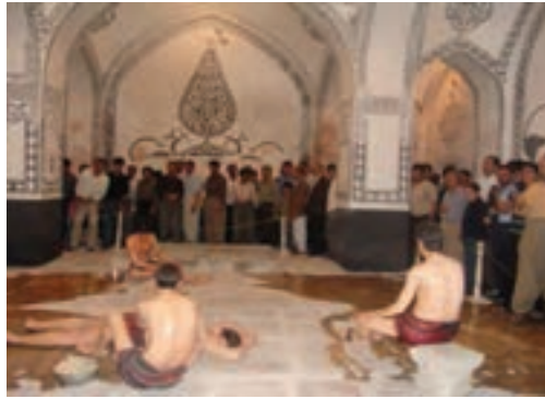
شکل ۱۹-۵- حمام خان