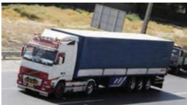
شکل ۳۷-۵ حمل و نقل جاده ای یکی از توانمندی های استان

● حمل و نقل: موقعیت مناسب جغرافیایی ناشی از استقرار بر محور شمال غربی - جنوب غربی کشور و هم مرزی با کشور عراق و امکان توسعه مبادلات با این کشور، شرایط مناسبی را برای گسترش حمل و نقل و استفاده از آن به عنوان یکی از مزیت های استان کردستان فراهم کرده است. استان کردستان به عنوان حلقه اتصال جنوب و جنوب غربی ایران با مناطق شمال غرب کشور شناخته می شود. طول راه های اصلی استان ۳۲۰ کیلومتر و طول راه های فرعی آسفالتی ۱۲۴۷ کیلومتر است.