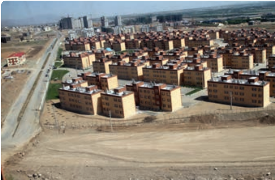
شکل ۱- ۱۵- مسکن مهر