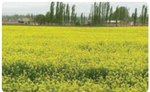
شکل ۱۴-۱- تغییر شیوه‌های سنتی و تبدیل آن به کشت‌های جدید