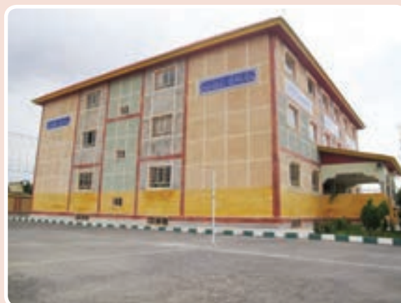
شکل ۱۲-۱۴- مدارس

جدول ۱۳-۱۴- تعداد دانش‌آموزان و کارکنان آموزشی کلیه مقاطع تحصیلی ۹۲-۱۳۹۱