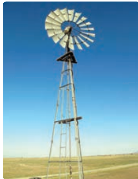
شکل ۱۸-۱۴ استفاده از انرژی‌های نو