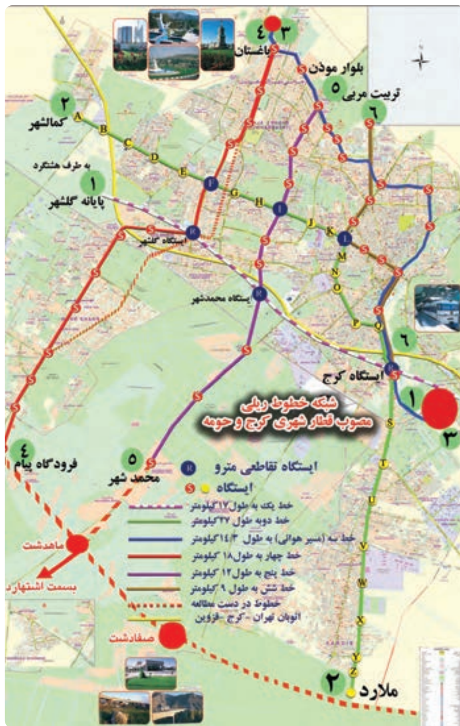
شکل ۹-۱۴ نقشه خطوط مترو کرج و حومه