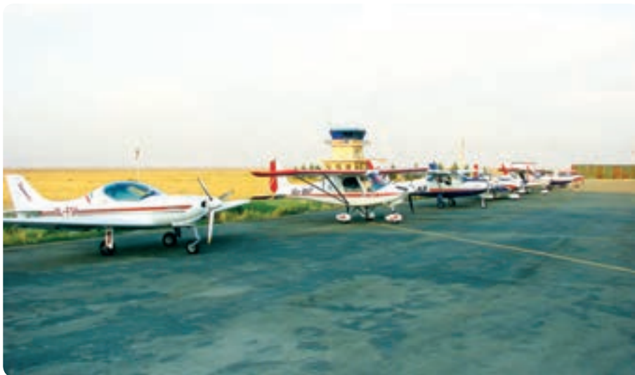
شکل ۱۱-۱۴- فرودگاه آزادی - نظرآباد

✳️ فرودگاه آزادی: این مجتمع فرودگاهی سال ۱۳۷۹ در شرق روستای صالحیه شهرستان نظرآباد افتتاح شد. مهم‌ترین اهداف احداث این فرودگاه تربیت نیروی انسانی در زمینه طراحی و ساخت هواپیماهای کوچک و آموزش هوانوردی است.