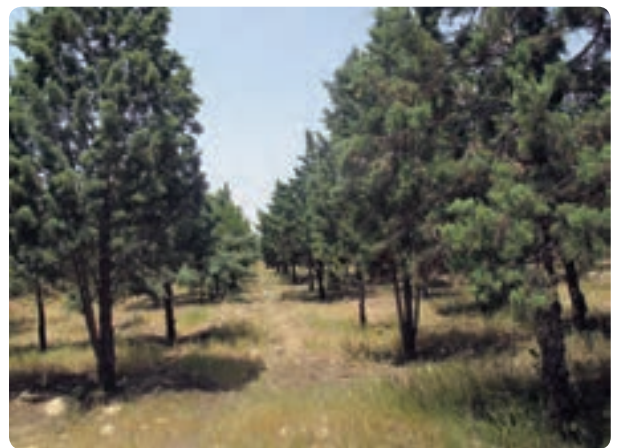
شکل ۱۹-۱۴ مهار آب‌های سطحی و جنگل‌های دست کاشت