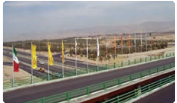
شکل ۷-۱۴- راه‌های استان