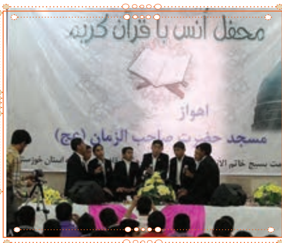
انس با قرآن کریم در استان خوزستان

با راهنمایی آموزگار خود پس از آوردن قرآن کریم از دفتر مدرسه، آن را به صورت تصادفی باز کنید و از روی آن بخوانید.