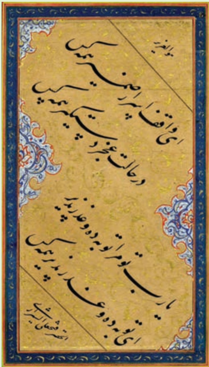
چلیپای نستعلیق / اثر آقا فتحعلی حجاب شیرازی