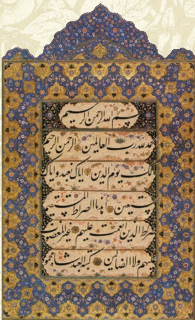
قطعه نستعلیق (سوره حمد) اثر شاه محمود نیشابوری (زنده ۸۹۸ ق)