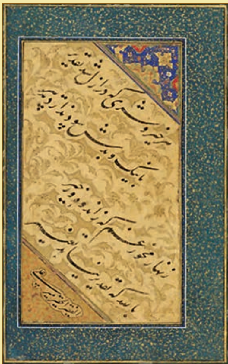
چلیپای نستعلیق / اثر میر علی هروی (۹۵۱ ق)