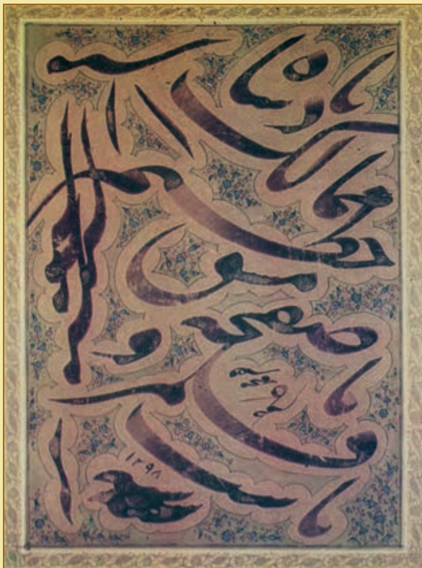
سیاه مشق نستعلیق / اثر میرزا کاظم (درگذشت ۱۳۲۵ ق)