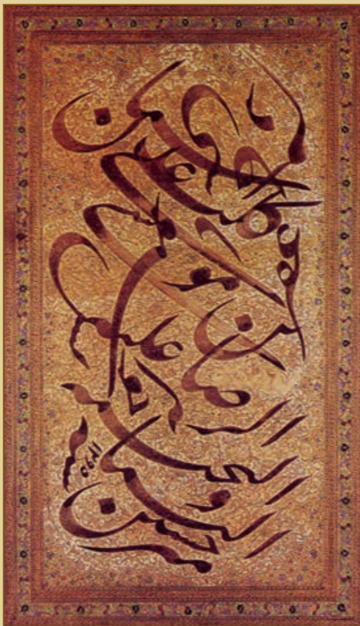
سیاه مشق نستعلیق / اثر میر حسین خوشنویس (درگذشت ۱۳۰۳ ق)